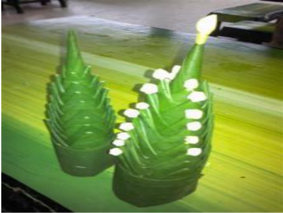
ภาพที่ ๕ หมากเบ็ง ๘ ชั้น