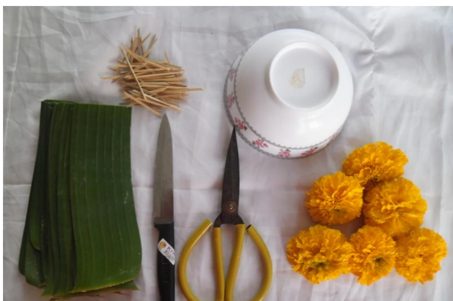
ภาพที่ ๑ อุปกรณ์การประดิษฐ์

ขั้นตอนการประดิษฐ์เครื่องสักการะหมากเบ็งหรือขันหมากเบ็ง