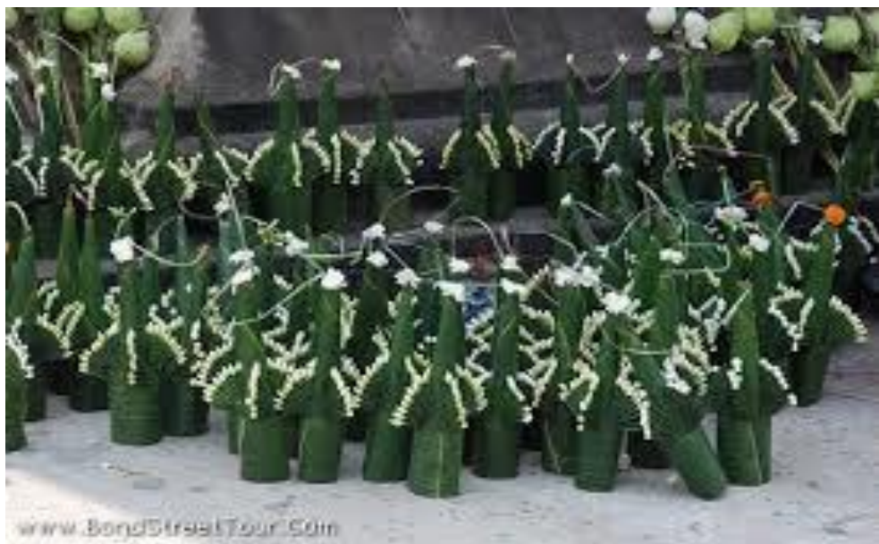
ภาพที่ ๒ หมากเบ็ง ๘ ชั้น