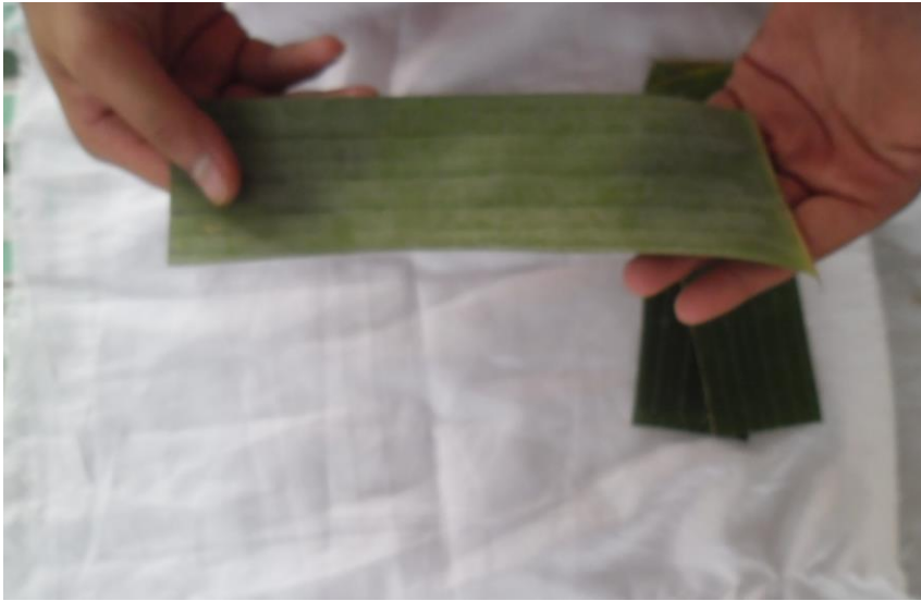
ภาพที่ ๕ การทำกลีบ