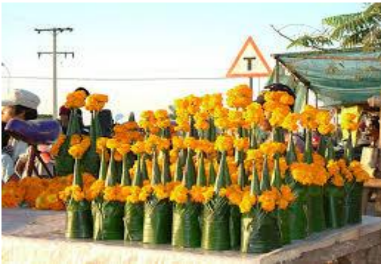
ภาพที่ ๑๗ หมากเบ็ง