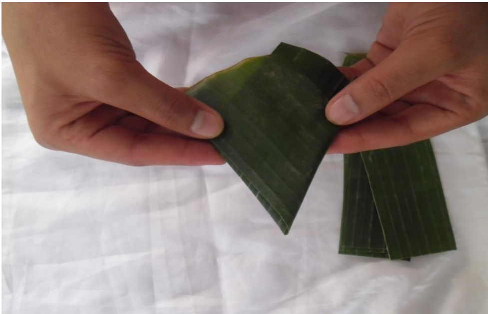
ภาพที่ ๗ พับกลีบ