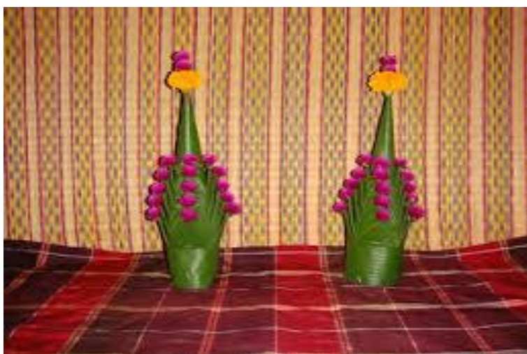
ภาพที่ ๑๖ หมากเบ็ง