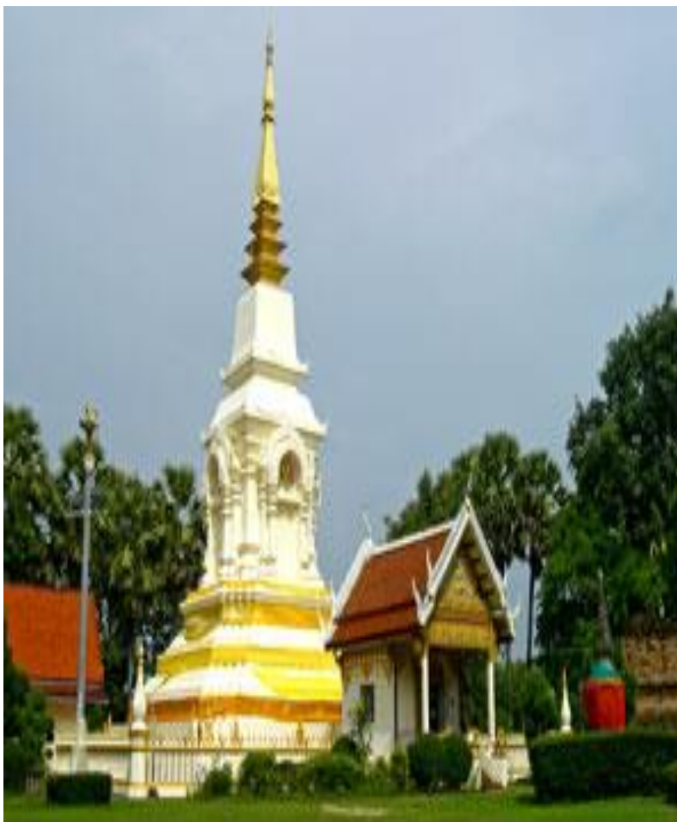
พระธาตุบังพวน