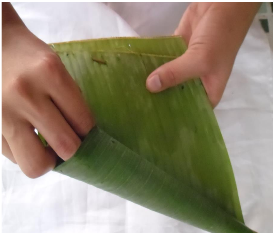
ภาพที่ ๓ การตกแต่งกรวย