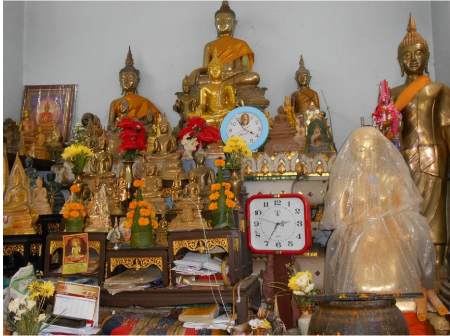
ภาพที่ ๙ หมากเบ็ง บูชาพระ