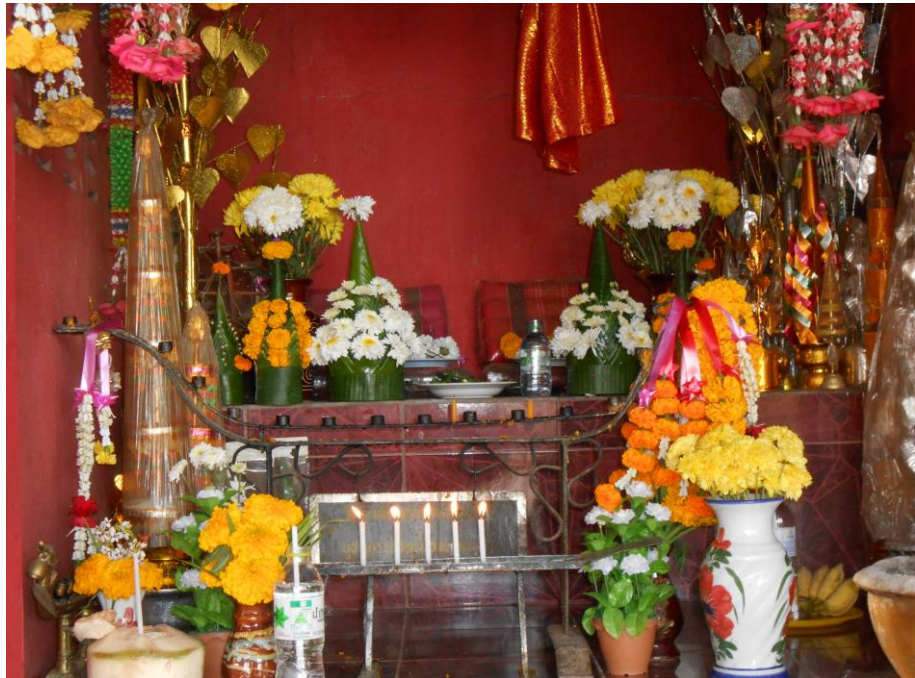
ภาพที่ ๑๐ หมากเบ็ง บูชาพระธาตุหล้าหนอง