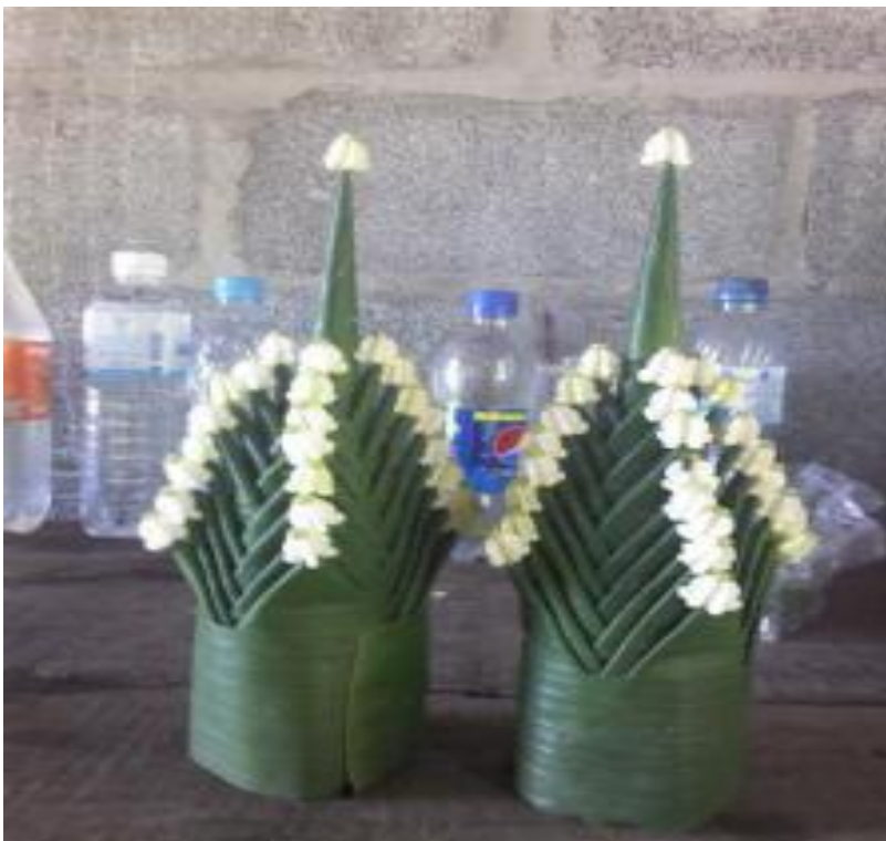
ภาพที่ ๑๘ หมากเบ็ง