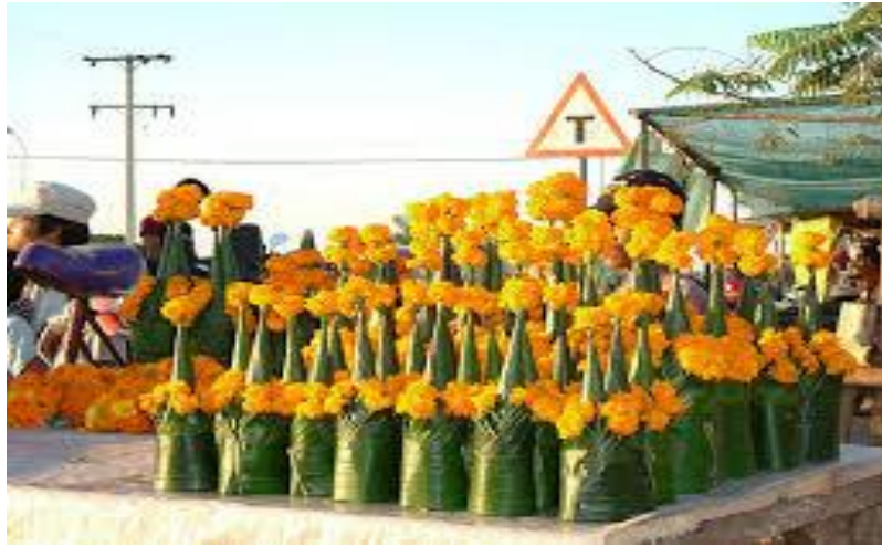
ภาพที่ ๓ หมากเบ็ง