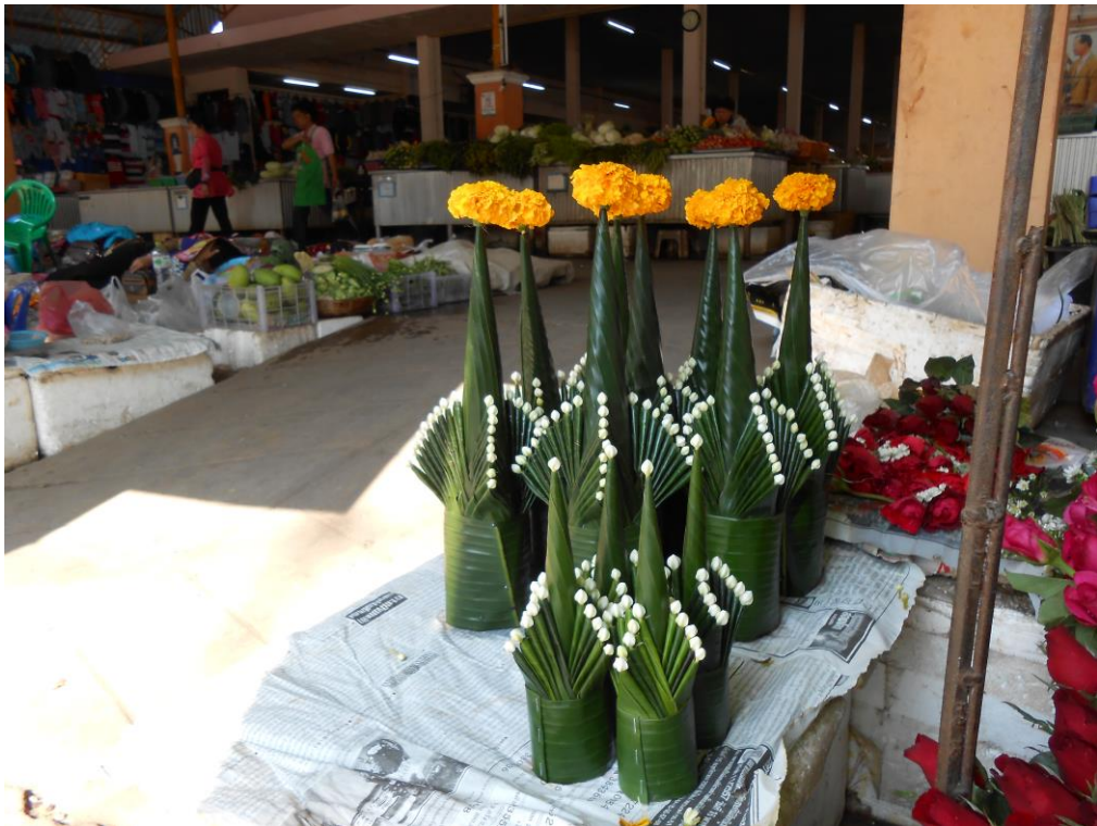
ภาพที่ ๘ หมากเบ็ง ๕ และ ๘ ชั้น วางจำหน่ายที่ตลาด