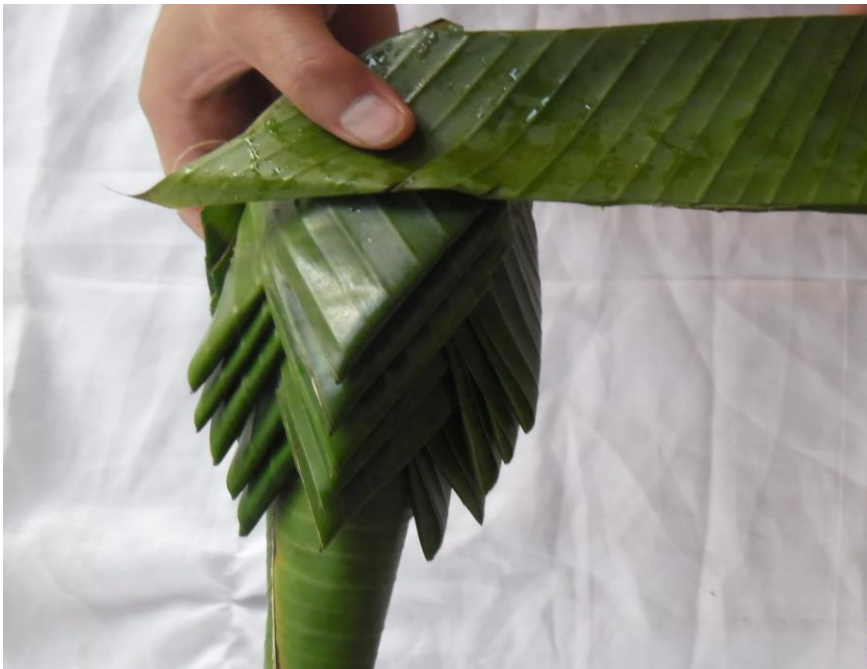
ภาพที่ ๑๐ การพับผ้านุ่ง