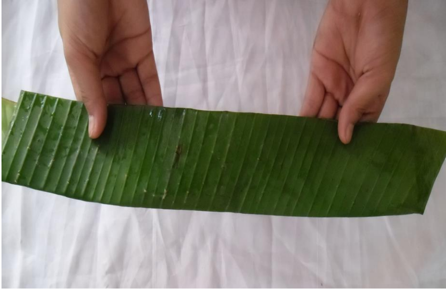
ภาพที่ ๙ การพับผ้านุ่ง

ส่วนที่ ๓ การพับผ้านุ่ง หรือ การมอบ พับผ้านุ่งโดยพับครึ่งใบตองพับรอบฐานเปิดโดน กลีบสุดท้ายกว้าง ๔ นิ้ว ใช้ไม้กีดหรือลวดเย็บๆและตัดแต่งฐานให้เรียบร้อย