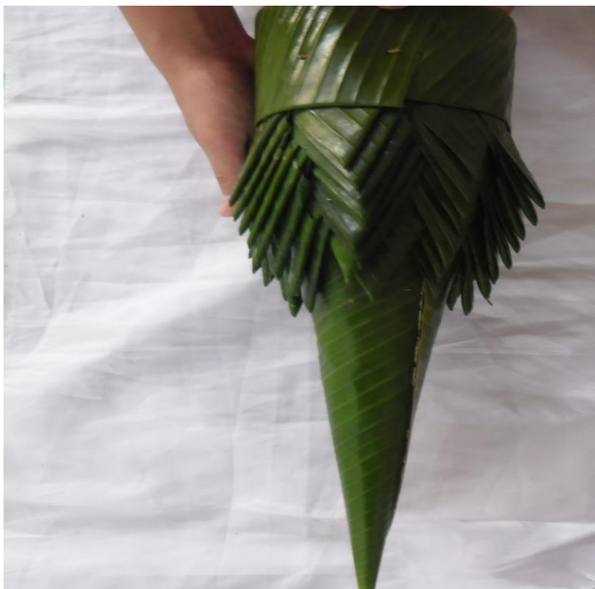
ภาพที่ ๑๓ การพับผ้านุ่ง