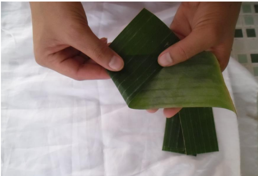
ภาพที่ ๖ พับกลีบ