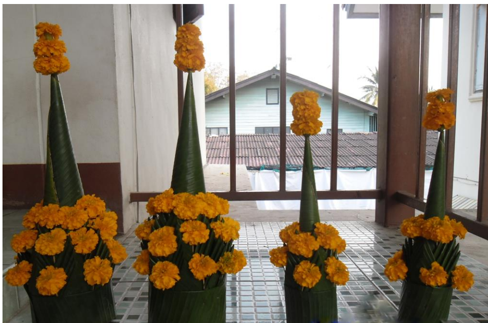
ภาพที่ ๑๕ ชั้นหมากเบ็งหรือชั้นหมากเบ็ง ๕ ชั้น และ ๘ ชั้น