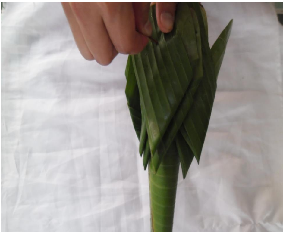
ภาพที่ ๘ ตัดกลีบเข้ากับกรวย