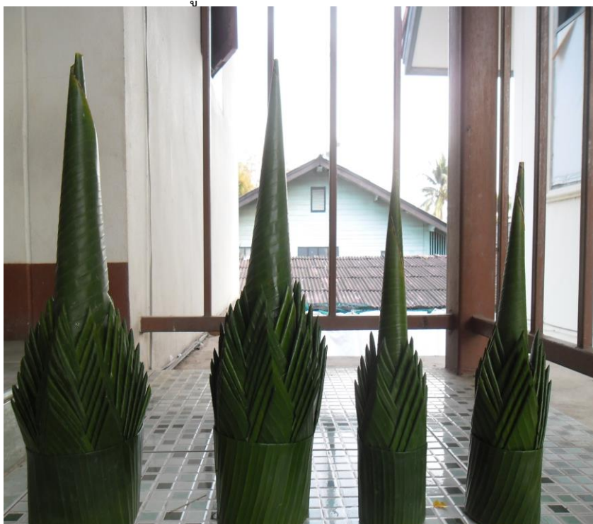
ภาพที่ ๑๔ หมากเบ็ง