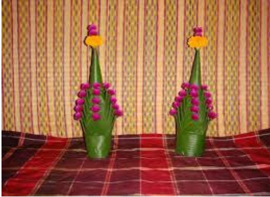
ภาพที่ ๑ หมากเบ็ง ๕ ชั้น