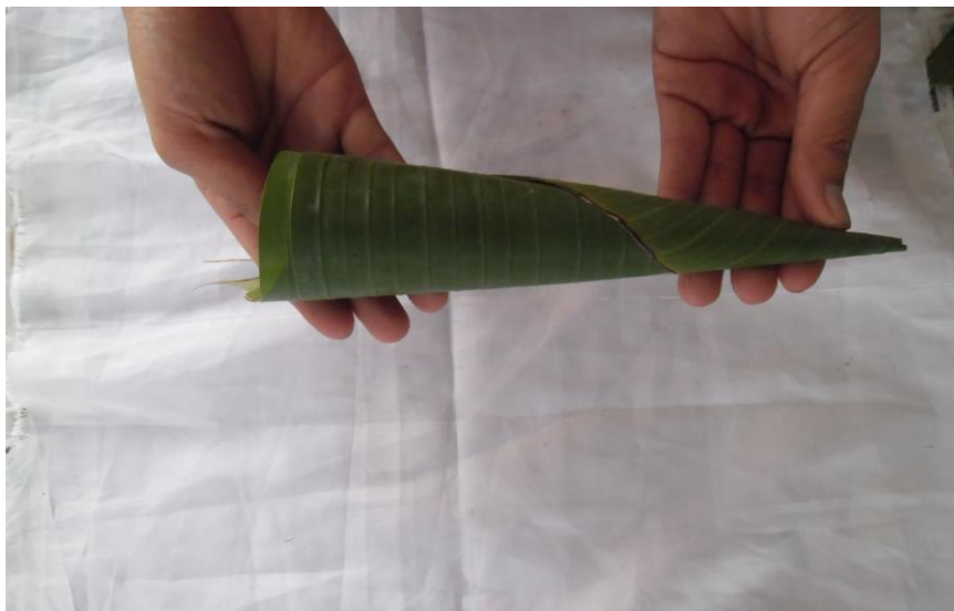
ภาพ ที่ ๔ กรวย