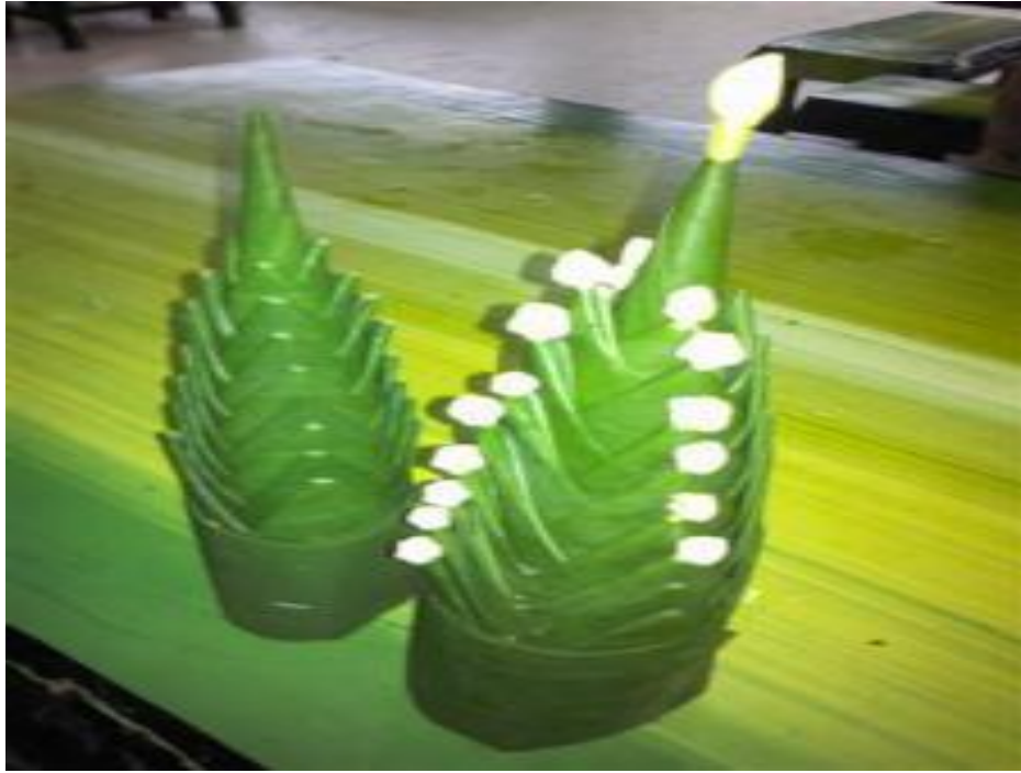
ภาพที่ ๕ หมากเบ็ง ๘ ชั้น