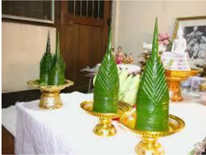
ภาพที่ ๗ หมากเบ็ง ๘ ชั้น