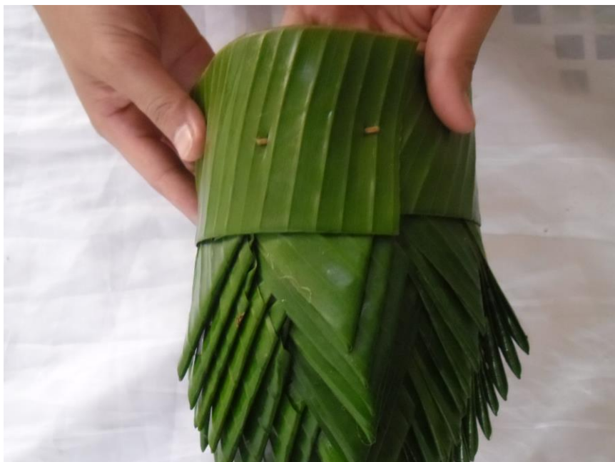
ภาพที่ ๑๑ การพับผ้านุ่ง