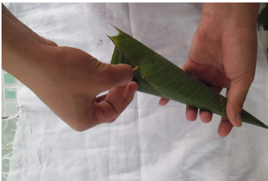
ภาพที่ ๔ การตกแต่งกรวย