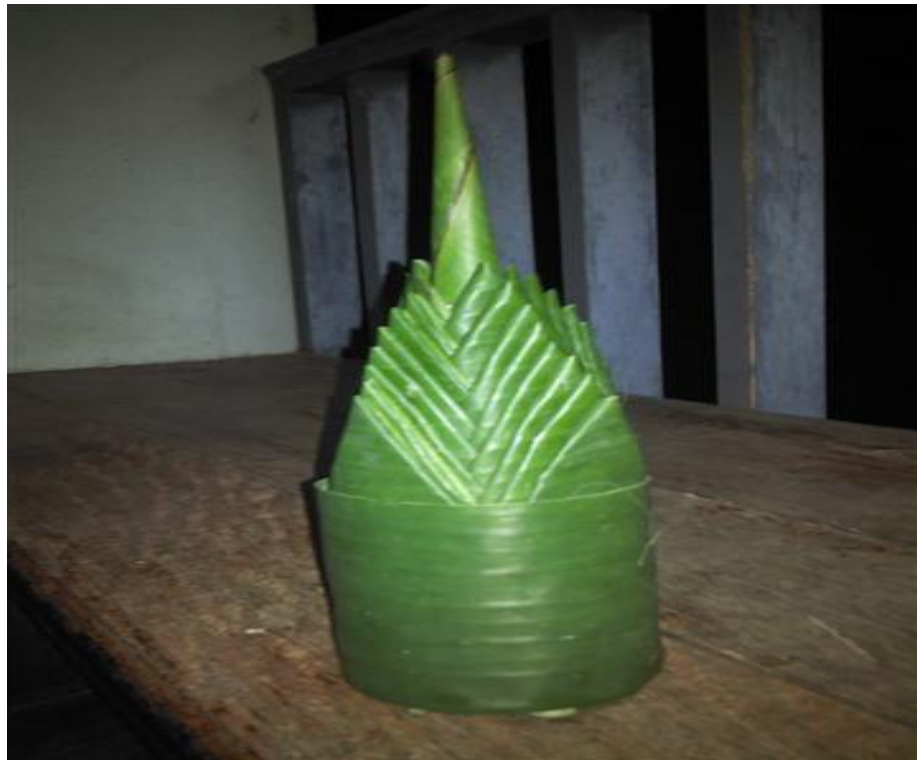
ภาพที่ ๖ หมากเบ็ง ๘ ชั้น