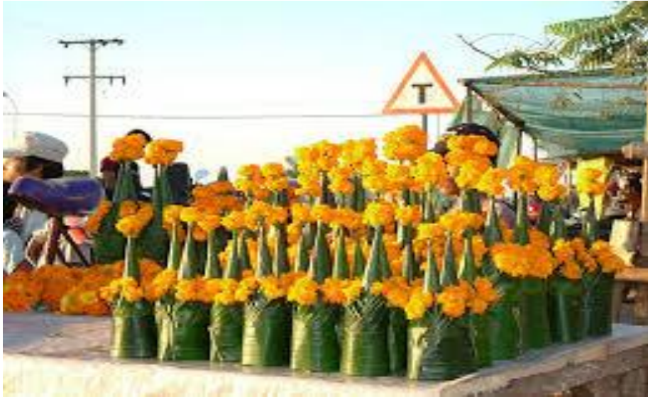
ภาพที่ ๓ หมากเบ็งทั่วไป