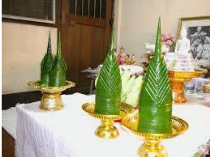
ภาพที่ ๗ หมากเบ็ง ๘ ชั้น