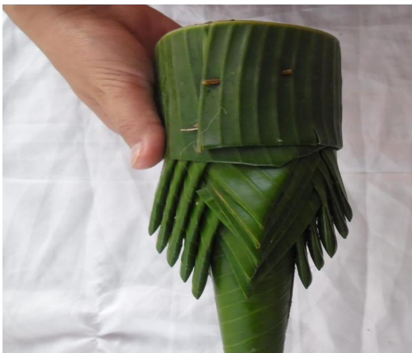
ภาพที่ ๑๒ การพับผ้านุ่ง