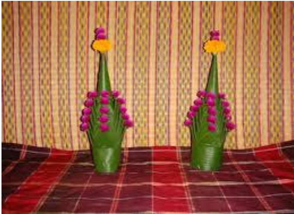
ภาพที่ ๑ หมากเบ็ง ๕ ชั้น