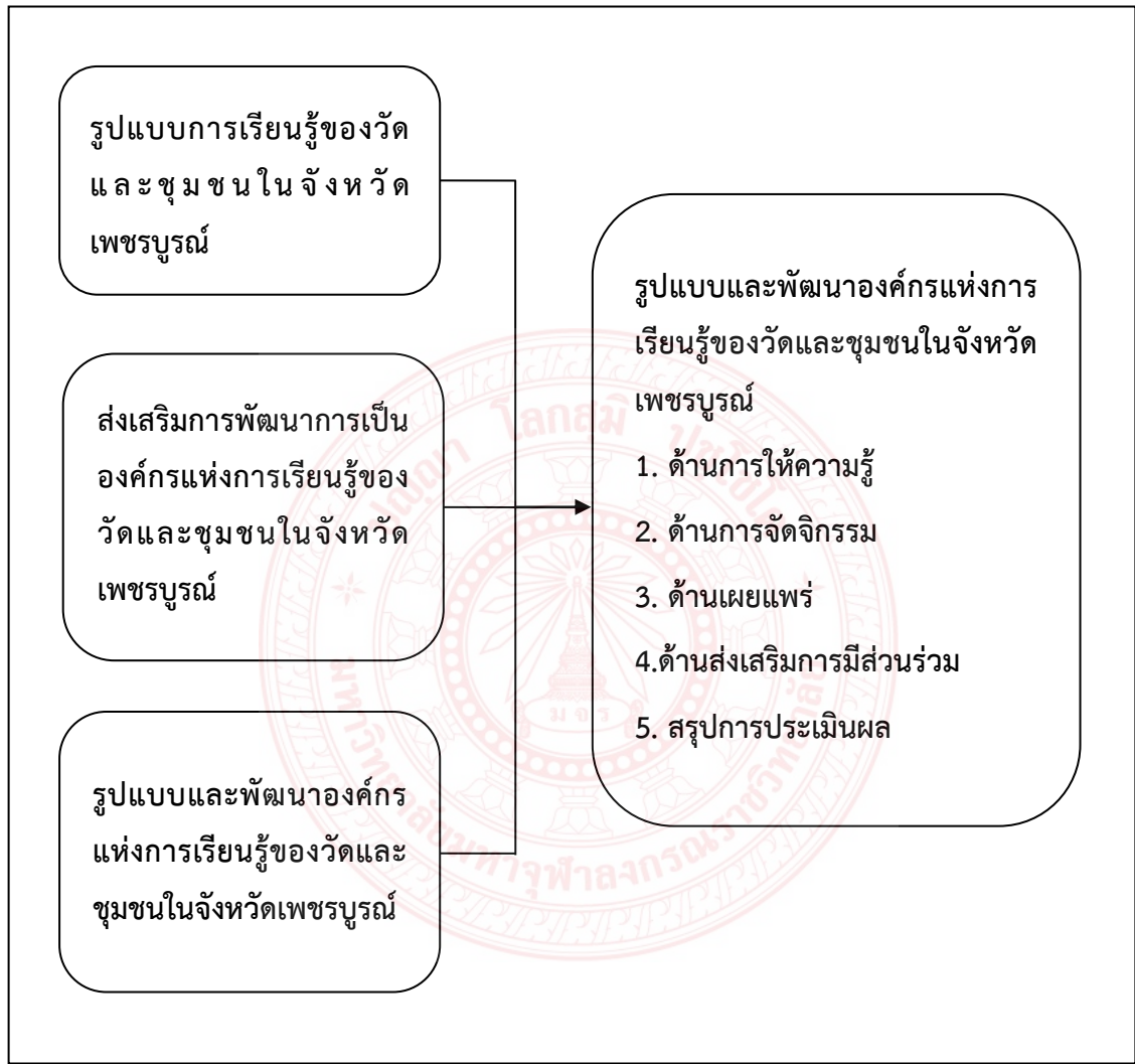
แผนภาพที่ 2.1 กรอบแนวคิดการวิจัย