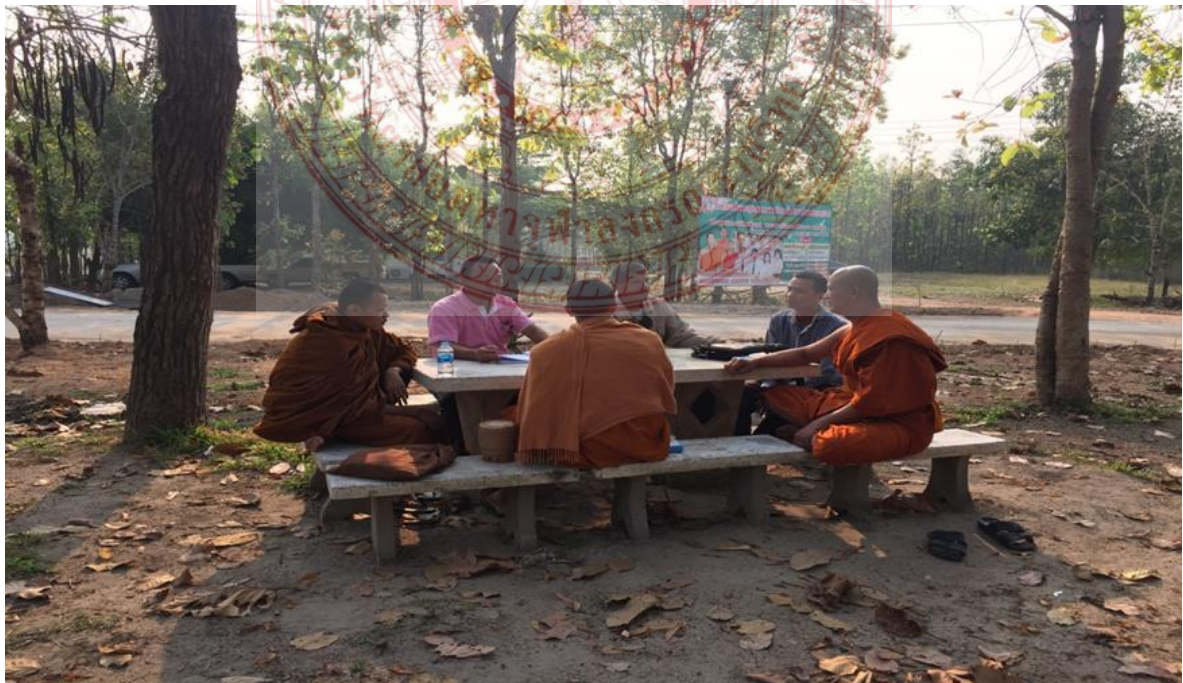
กิจกรรมสัมมนาและการสนทนากลุ่ม โรงเรียนปริยัติธรรมแผนกสามัญ