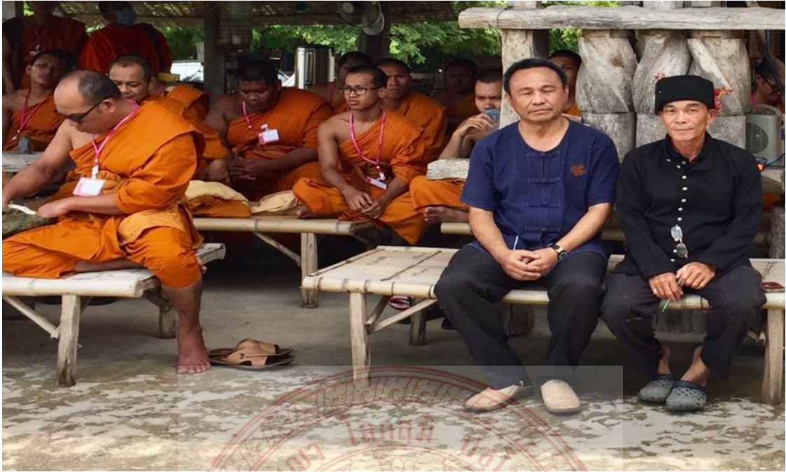
กิจกรรมนิสิตร่วมศึกษาชุมชนไทดำบ้านนาป่าหนาด อำเภอเชียงคาน