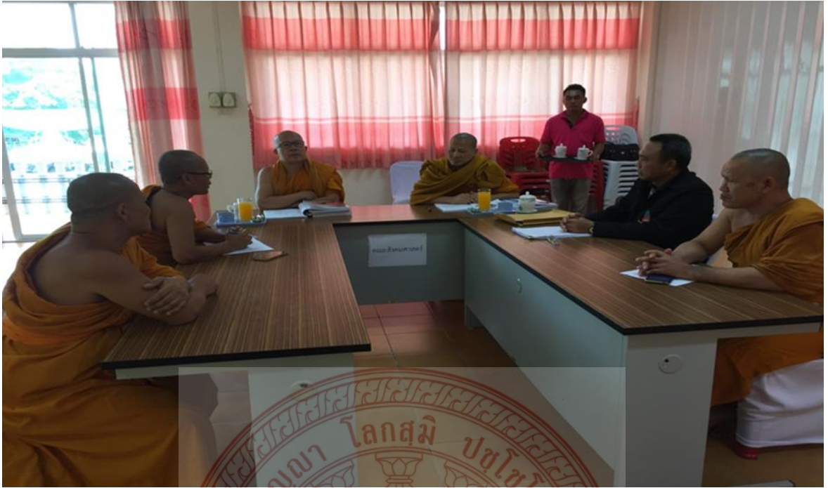
กิจกรรมสัมภาษณ์และการสนทนากลุ่ม โรงเรียนปริยัติธรรมแผนกสามัญ