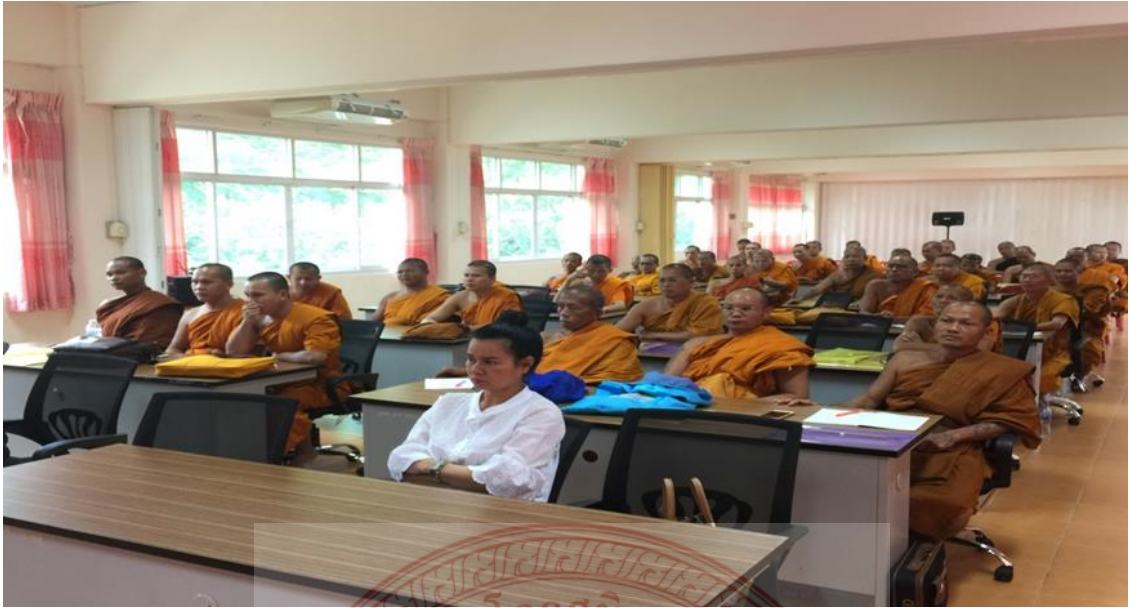
กิจกรรมใช้สมุดบันทึกแห่งการทำความดี ศรีจันทร์วิทยา (ปริยัติธรรมแผนกสามัญ)