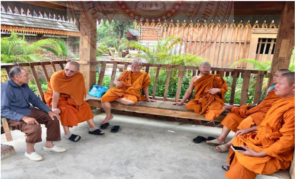
กิจกรรมสัมภาษณ์และการสนทนากลุ่ม โรงเรียนปริยัติธรรมแผนกสามัญ