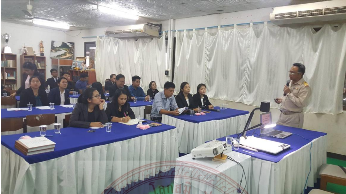
กิจกรรมสัมมนาและการสนทนากลุ่ม โรงเรียนมัธยมพื้นที่เขต ๑๙