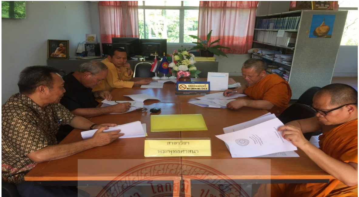
กิจกรรมสัมมนาและการสนทนากลุ่ม วิทยาลัยสงฆ์เลย