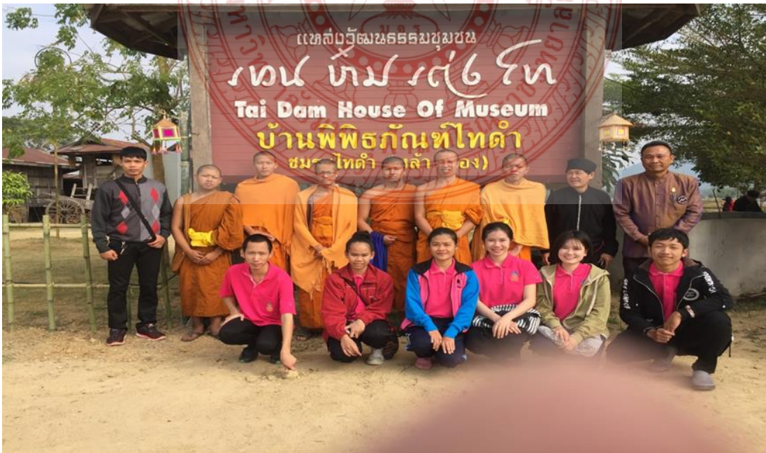
กิจกรรมนิสิตร่วมศึกษาชุมชนไทดำบ้านนาป่าหนาด อำเภอเชียงคาน