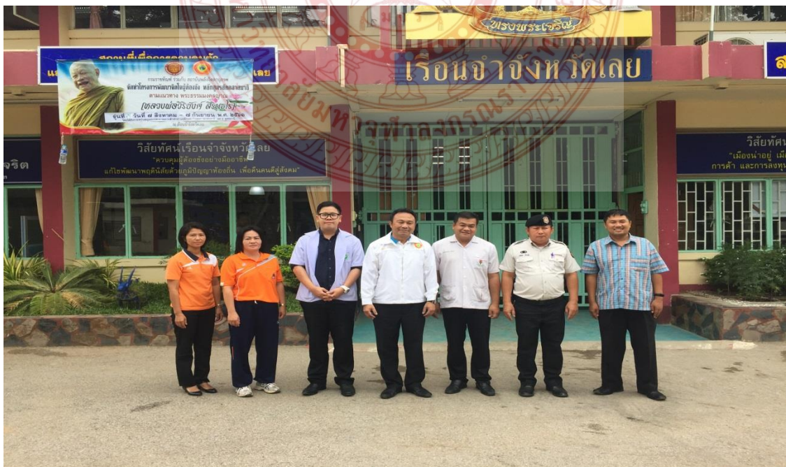
กิจกรรมสัมภาษณ์และการสนทนากลุ่ม โรงเรียนเจ้าจังหวัดเลย และวัฒนธรรมจังหวัดเลย