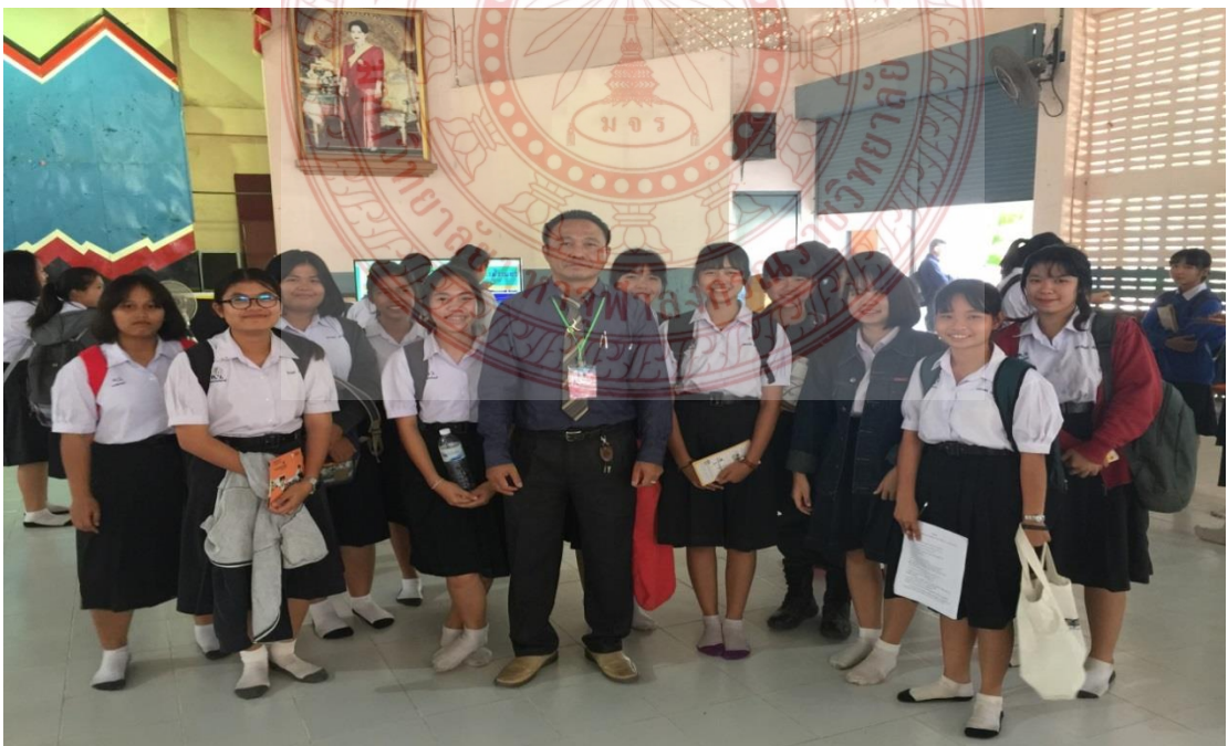
จัดกิจกรรมใช้สมุดบันทึกแห่งการทำความดี โรงเรียนนาอ้อ อำเภอมือเอย จังหวัดเลย