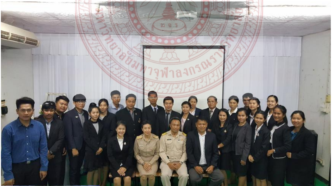
กิจกรรมสัมมนาและการสนทนากลุ่ม โรงเรียนมัธยมพื้นที่เขต ๑๙