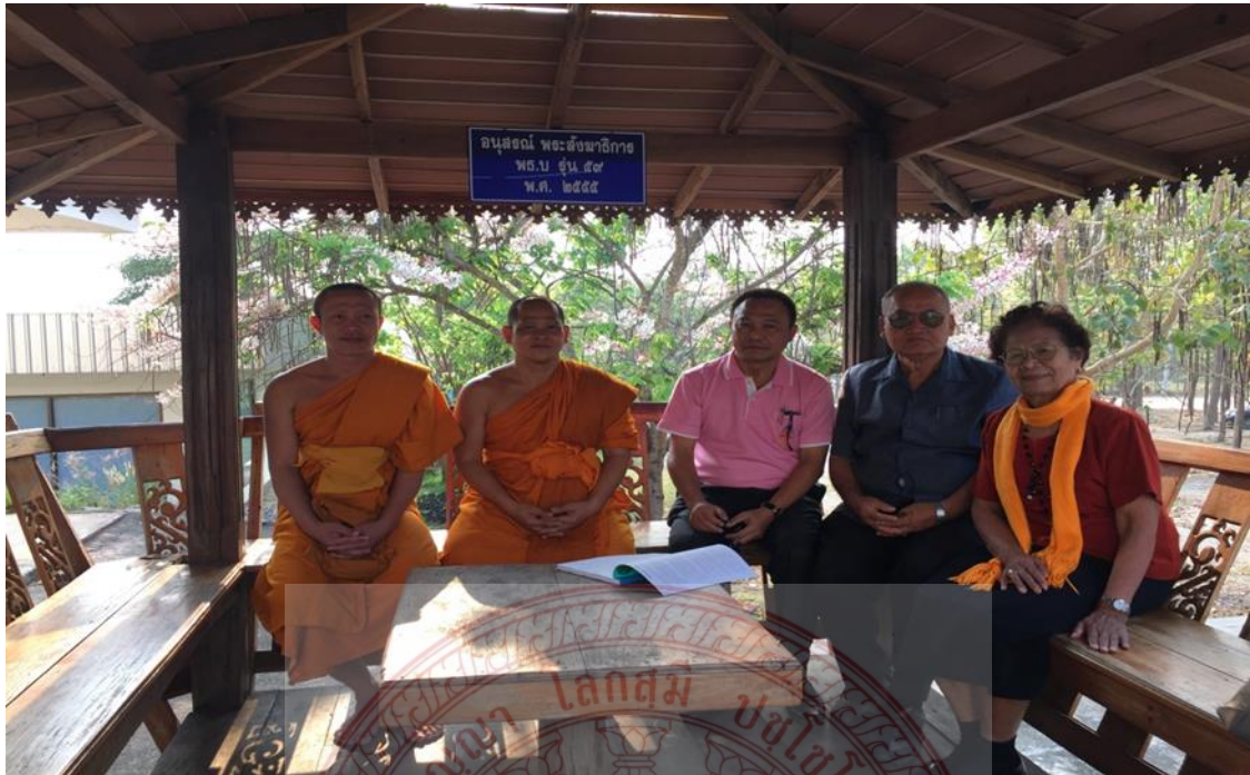
กิจกรรมสัมภาษณ์ผู้บริหาร โรงเรียนปริยัติธรรมแผนกสามัญ