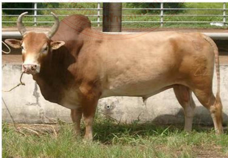
ภาพที่ ๒.๑ โคอีสาน

ลักษณะประจำพันธุ์ มีขนสั้นเกรียน โดยทั่วไปมีลำตัวสีน้ำตาลแกมแดง แต่อาจมีสีแตกต่างกันหลายสี เช่น ดำ แดง น้ำตาล ขาว เหลือง เป็นต้น หน้ายาวบอบบาง หน้าผากแคบ ตะโพนกเล็ก เหนียงคอ และหนังใต้ท้องไม่มากนักมีรูปร่างขนาดเล็ก น้ำหนักแรกเกิด ๑๖ กก. น้ำหนักหย่านมเมื่ออายุ ๒๐๐ วันเฉลี่ย ๙๔ กก. น้ำหนักโตเต็มที่ เพศผู้ ๓๐๐ - ๓๕๐ กก. เพศเมีย ๒๒ - ๒๕๐ กก. อายุเมื่อให้ลูกตัวแรก ๒.๗๑ ปี ระยะการอุมท้อง ๒๗๐ - ๒๗๕ วัน ช่วงห่างการให้ลูก ๓๙๕ วัน การกระจายของประชากร เลี้ยงกันมากทางภาคตะวันออกเฉียงเหนือทั้งตอนล่างและตอนบน เพื่อใช้ลากจูง เเทียมเกวียน และเป็นอาหารโปรตีนที่สำคัญโดยเฉพาะในงานพิธีและเทศกาลที่สำคัญ