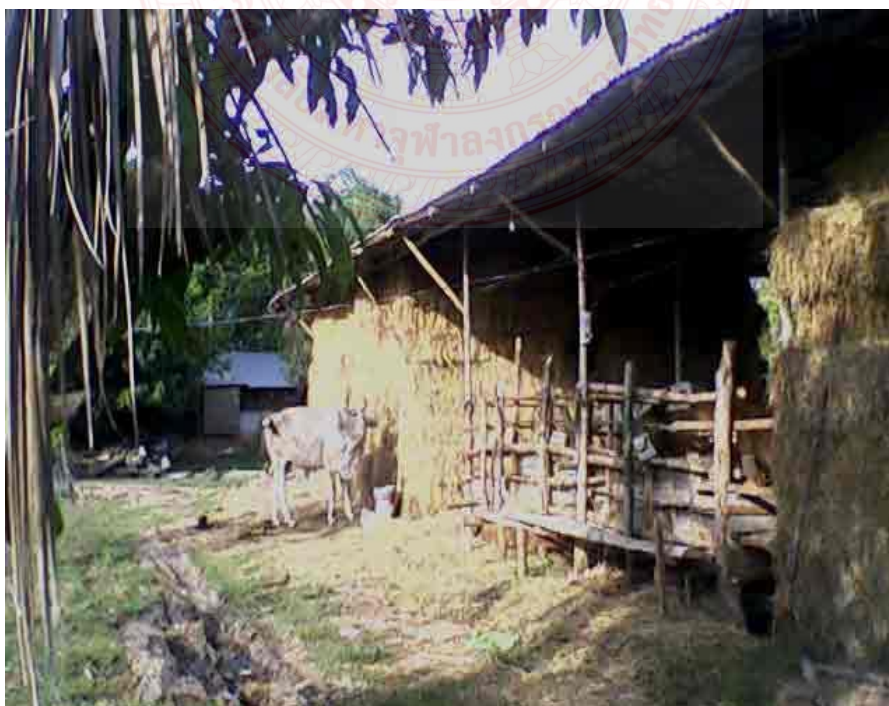
ภาพที่ ๓.๒ การเลี้ยงโคเนื้อแบบชังคอก

การเลี้ยงโคเนื้อแบบชังคอก ลักษณะการเลี้ยงคือจำกัดจำกัดพื้นที่ โดยให้โคอยู่ในคอกหรือโรงเรือน เกษตรกรเป็นผู้หาอาหารหยาบโดยตัดมาให้กินทุกมื้อ และมีการเสริมอาหารข้นเพื่อเพิ่มคุณค่าทางอาหารเพื่อให้โคเจริญเติบโตอย่างรวดเร็วในระยะเวลาอันสั้น เกษตรกรจะซื้อพันธุ์โคมาจากตลาดนัดโคเป็นส่วนใหญ่ รองลงมาจะซื้อจากฟาร์มเกษตรกร พันธุ์โคที่เกษตรกรเลี้ยงคือ โคพันธุ์ลูกผสมอเมริกันบราห์มัน รองลงมาคือโคพันธุ์ลูกผสมฮินดูบราซิล เลี้ยงในระยะสั้นๆ ๓-๖ เดือนแล้วขาย ลักษณะโรงเรือนของโคชังคอกจะมีความทนทานแน่นหนากว่าโคปล่อยฝูง โดยพื้นคอกเป็นพื้นปูนซีเมนต์ และเป็นพื้นดินโรงเรือนจะมุงด้วยกระเบื้องและสังกะสีรั้วจะทำด้วยไม้ไผ่รองลงมาคือไม้และเหล็กแป็บอาหารจะเป็นรางฉาบด้วยปูนซีเมนต์และมีอ่างน้ำทุกฟาร์ม เกษตรกรจะให้อาหารโคชังคอกด้วยอาหารหยาบผสมอาหารข้น โดยการตัดมาให้กิน เกษตรกรมีการเก็บถนอมพืชอาหารหยาบเป็นการกักตุนไว้ในหน้าแห้งแล้ง และเกษตรกรทุกรายใช้แหล่งน้ำบาดาลในการเลี้ยงโคชังคอก นอกจากนั้นมีการเลี้ยงโคแม่พันธุ์ร่วมด้วย มีการเปลี่ยนพ่อพันธุ์คุมฝูง ประมาณ ๓ปีถึง๔ปีจะเปลี่ยนพ่อพันธุ์ต่อครั้ง อัตราการให้ลูกเฉลี่ยของแม่โคปีละ ๑ ตัว และมีการคัดโคสาวที่ผิดปกติออก เกษตรกรทุกฟาร์มไม่มีการตรวจโรคโคก่อนนำโคเข้าคอก เกษตรกรทุกรายมีการป้องกันโรค โดยการฉีดวัคซีนป้องกันโรคปากและเท้าเปื่อย ยาถ่ายพยาธิและยาบำรุง ๙