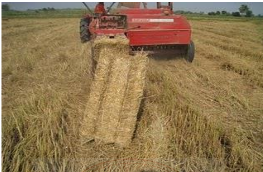
ภาพที่ ๓.๗ ฟางข้าวจากการเกี่ยวมือ และนวดด้วยรถนวด