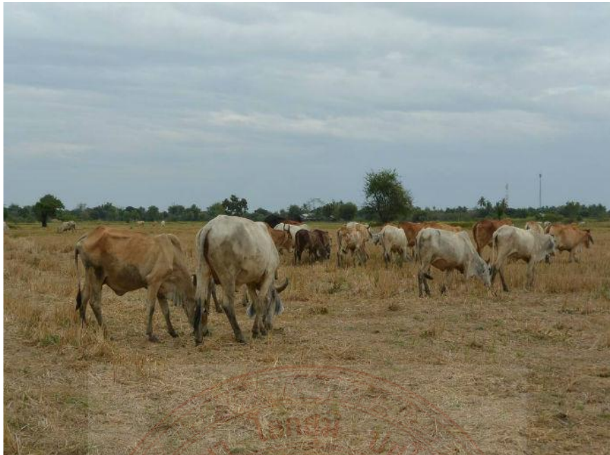
ภาพที่ ๓.๑ การเลี้ยงโคเนื้อแบบปล่อยฝูง

ปัจจุบันโคพื้นเมืองมีบทบาทที่สำคัญมากขึ้นเพราะการแข่งขันในการใช้พื้นที่การเกษตรเพื่อผลิตอาหารและเครื่องอุปโภคโดยเฉพาะการผลิตอาหารโปรตีนเพื่อให้พอเพียงกับการบริโภคในท้องถิ่น จากข้อมูลเศรษฐกิจการปศุสัตว์ประจำปีพ.ศ.๒๕๕๘ รายงานว่าจังหวัดเลยมีจำนวนโคเนื้อประมาณการ ๑๒,๗๖๑ ตัว เพิ่มขึ้นจากปีที่แล้ว ๔๓๑ตัว ในจำนวนนี้ประกอบด้วยโคพื้นเมือง ซึ่งเลี้ยงกระจายอยู่ตามอำเภอต่าง ๆ ของจังหวัด จำนวน ๑๒,๗๖๑ ตัว สำนักงานปศุสัตว์จังหวัดเลยได้เห็นถึงความสำคัญของการเลี้ยงโคพื้นเมืองเหล่านั้นไว้เพื่อเป็นแหล่งทรัพยากร ทางพันธุกรรมและการใช้ประโยชน์อย่างยั่งยืนเนื่องจากโคพื้นเมืองมีความสำคัญต่อชีวิตและความเป็นอยู่ของเกษตรกรส่วนใหญ่ของจังหวัด ในด้านใช้เป็นอาหารสัตว์ใช้งานธนาคารออมทรัพย์ของเกษตรกรรายย่อย เป็นส่วนหนึ่งของอารยธรรมและทรัพยากรของจังหวัด สำนักงานปศุสัตว์จังหวัดได้ดำเนินการโครงการวิจัยทดสอบ พันธุ์และกระจายพันธุ์โคพื้นเมืองในเกษตรกรรายย่อย โดยร่วมมือกับเกษตรกรในการวิจัยและพัฒนาพันธุ์โคพื้นเมืองในทั่วทุกอำเภอของจังหวัดทั้งในแง่ผลิตเป็นโคเนื้อและโคที่ใช้นมประจำท้องถิ่นนั้นๆส่งเสริมให้มีการรวมกลุ่มกันผลิตและจำหน่าย จัดวางแผนระบบการจดทะเบียนข้อมูลและฐานข้อมูลที่จะเอื้อประโยชน์ต่อการอนุรักษ์ ปรับปรุงการให้ผลผลิตให้สูงขึ้นกว่าเดิม กระจายพันธุกรรมโคพื้นเมืองที่ได้รับการปรับปรุงพันธุ์ แล้วอย่างมีระบบและพัฒนาเป็นสินค้าส่งออกในอนาคต ๔