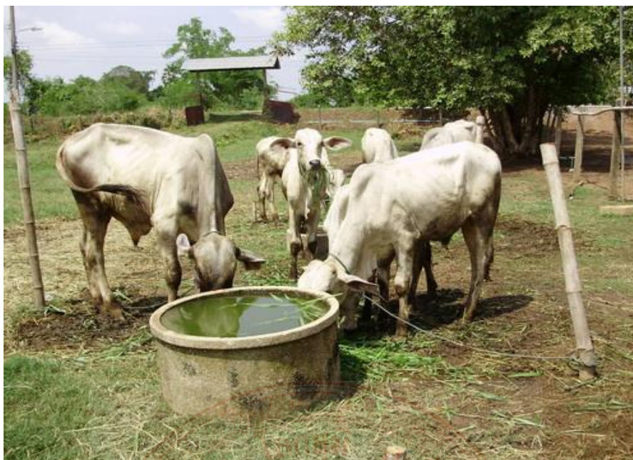
ภาพที่ ๓.๓ การเลี้ยงโคเนื้อแบบใช้พื้นที่จำกัด