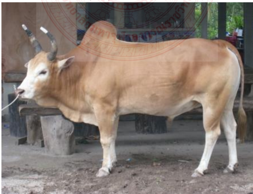
ภาพที่ ๒.๓ โคชน

ลักษณะประจำพันธุ์ มีสีแดง สีน้ำตาลอ่อน ดำ และต่าง ไม่มีเหนียงสะดือ มีเหนียงคอบาง น้ำหนักแรกเกิด ๑๕ กก. น้ำหนักหย่านมเมื่ออายุ ๒๐๐ วันเฉลี่ย ๘๘ กก. น้ำหนักโตเต็มที่ เพศผู้ ๒๘๐ - ๓๒๐ กก. เพศเมีย ๒๓๐ - ๒๘๐ กก. อายุเมื่อให้ลูกตัวแรก ๓ ปี ระยะการอุ้มท้อง ๒๗๐ - ๒๗๕ วัน การกระจายของประชากร นิยมเลี้ยงกันมากทางภาคใต้ ซึ่งจากการที่คนภาคใต้ส่วนใหญ่ประกอบอาชีพทำนา เมื่อหลังฤดูเก็บเกี่ยวประมาณเดือนมีนาคม - เมษายน ชาวนาจะปล่อยโคออกหากินตามท้องทุ่งเป็นฝูงใหญ่ โคจากในหมู่บ้านและต่างหมู่บ้านมีโอกาสได้พบกัน ประกอบกับเป็นช่วงฤดูผสมพันธุ์โคตัวผู้จึงชนกันแย่งชิงเป็นจำฝูง เพื่อจะได้ยึดครอบโคตัวเมีย ชาวบ้านจึงได้เห็นลีลาการชนของโค บางตัว เกิดความรู้สึกรำคาญ ประทับใจ และคัดเลือกไว้เป็นโคชน ซึ่งโคชนจะต้องเป็นโคตัวผู้ที่มีลักษณะดี มีอายุประมาณ ๔ - ๖ ปี ต้องมีสายพันธุ์เป็นโคชนโดยเฉพาะ ผ่านการเลี้ยงดูพิถีพิถันให้ร่างกายแข็งแรงและฝึกชนบ่อย ๆ จนกลายเป็นโคชนที่มีคุณสมบัติเด่นเฉพาะ เช่น แข็งแรงสมบูรณ์ มีไหวพริบในการชน และทรหดอดทนเป็นพิเศษ เป็นต้น โคชนมีมากที่สุดในจังหวัดนครศรีธรรมราช พัทลุง ตรัง และสงขลา ในปี ๒๕๓๘ กรมปศุสัตว์จัดซื้อโคเพศผู้ ๑๐ ตัว เพศเมีย ๑๐๐ ตัว นำไปเลี้ยงและขยายพันธุ์ที่ สถานีบำรุงพันธุ์สัตว์นครศรีธรรมราช อำเภอร่อนพิบูลย์ จังหวัดนครศรีธรรมราช และในปี ๒๕๔๓ ได้จัดซื้อเพิ่มเติมเป็นโคเพศผู้ ๒๔ ตัว และเพศเมีย ๖๐๐ ตัว นำไปเลี้ยงที่ สถานีบำรุงพันธุ์สัตว์นครศรีธรรมราช สถานีบำรุงพันธุ์สัตว์เทพา อำเภเทพา จังหวัดสงขลา สถานีบำรุงพันธุ์สัตว์กระบี่ อำเภเมือง จังหวัดกระบี่ และสถานีบำรุงพันธุ์สัตว์ตรัง อำเภห้วยยอด จังหวัดตรัง