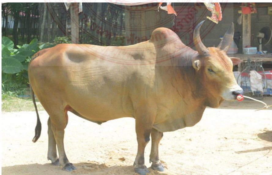
ภาพที่ ๒.๔ โคลาน

ลักษณะประจำพันธุ์ นิสัยเปรียว ตีนตลกใจง่าย ลำตัวยาวบาง มีสีแดง สีน้ำตาลอ่อน น้ำตาล แก่ ดำ และดำไม่มีเหนียงสะดือ มีเหนียงคอบาง น้ำหนักแรกเกิด ๑๔ กก. น้ำหนักหย่านมเมื่ออายุ ๒๐๐ วันเฉลี่ย ๗๘ กก. น้ำหนักโตเต็มที่ เพศผู้ ๒๘๐-๓๐๐ กก. เพศเมีย ๒๐๐-๒๖๐ กก. อายุเมื่อให้ ลูกตัวแรก ๓ ปี ระยะการอุ้มท้อง ๒๗๐-๒๗๕ วัน ในปี ๒๕๕๓ กรมปศุสัตว์จัดซื้อโคเพศผู้ ๔ ตัว เพศ เมีย ๑๐๐ ตัว นำไปเลี้ยงและขยายพันธุ์ที่ศูนย์วิจัยและบำรุงพันธุ์สัตว์หนองขาว อำเภोधธาาราม จังหวัดราชบุรี การกระจายของประชากร นิยมเลี้ยงกันมากในภาคกลาง โดยเฉพาะจังหวัดเพชรบุรี ราชบุรี กาญจนบุรี ประจวบคีรีขันธ์ นครปฐม และสุพรรณบุรี จากการที่เกษตรกรในจังหวัดดังกล่าว ส่วนใหญ่ประกอบอาชีพทำนา เมื่อเพราะปลูกเสร็จแล้ว พอถึงฤดูเก็บเกี่ยวข้าวเกษตรกรจะนำข้าวที่ เก็บเกี่ยวแล้วมาวางเรียงไว้ในลักษณะวงกลม มีเสาไม้เป็นจุดศูนย์กลางสำหรับผูกโคราว(คาน) โดยใช้ วิธีขอแรงงานจากโคของเพื่อนบ้านมาช่วย ซึ่งจะผูกโคเรียงเป็นแถวรายตัวให้พอเพียงกับข้าวที่ตั้งกอง รายล้อมไว้ จากนั้นไล่โควิ่งวนเวียนรอบ ๆ เสาไม้ที่ปักไว้จนกว่าเมล็ดข้าวจะร่วงหล่นจากรวง เกษตรกร จะช่วยกันเก็บฟางข้าวออกจนหมดให้เหลือเฉพาะเมล็ดข้าวเปลือก หลังจากเสร็จสิ้นการเก็บข้าวแล้ว เกษตรกรจะมีเวลาวางในช่วงเดือนมีนาคม - พฤษภาคม จึงได้มีผู้คิดนำวิธีการนี้มาใช้และเพิ่มจำนวนโค ที่วิ่งให้มากขึ้น นิยมจัดการแข่งขันในบริเวณวัด ต่อมาเริ่มจัดการแข่งขันนอกวัด จากเริ่มแรกเพื่อความ สนุกสนานและต่อมาได้มีการพัฒนาวิธีการแข่งขันเรื่อย ๆ จนถึง ปี พ.ศ. ๒๕๐๐ จึงได้ริเริ่มเดิมพันการ แข่งขันวิ่งวัวลานกันขึ้น