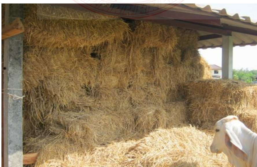
ภาพที่ ๓.๘ ฟางข้าวจากรถอัดฟางข้าว

การอัดฟางข้าวที่กองในแปลงนาหลังการไถรถเกี่ยวข้าว ซึ่งจะเป็นฟางผสมระหว่างตอซัง และฟางข้าวส่วนบนฟางข้าวที่หล่นในแปลงนาหลังการเกี่ยวข้าวด้วยรถเกี่ยวข้าวจะเป็นฟางข้าวที่มีการแตกขาดเป็นเส้นเหมือนกับฟางข้าวที่แยกเมล็ดด้วยเครื่องนวดข้าว และฟางชนิดนี้จะถูกปล่อยทิ้งตามแปลงนา ต้องใช้รถเก็บฟางข้าวรวบรวมอีกครั้ง ซึ่งจะได้ฟางข้าวจากการเกี่ยวข้าวร่วมกับฟางข้าวจากตอซังรวมกัน