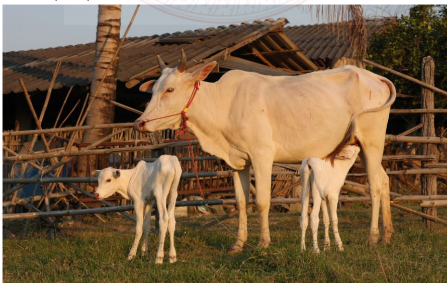
ภาพที่ ๒.๒ โคขาวลำพูน