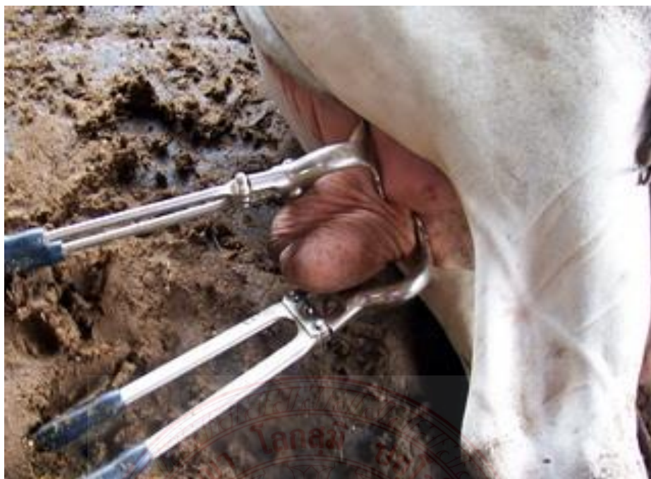
ภาพที่ ๓.๕ การตอนโคเนื้อ

ภูมิปัญญาการจัดเก็บฟางข้าว เป็นส่วนของต้นข้าวที่เหลือหลังการเก็บเกี่ยว และนำเมล็ดข้าวออกแล้ว แบ่งเป็น ๓ ประเภท คือ ๑.ฟางข้าวจากการเกี่ยวมือและนวดมือ ๒.ฟางข้าวจากการเกี่ยวมือและนวดด้วยรถนวด และ ๓.ฟางข้าวจากรถตัดฟางข้าว ฟางข้าวนี้ถือเป็นผลพลอยได้ทางการเกษตรจากนาข้าวที่มีประโยชน์ใน