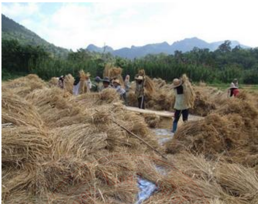
ภาพที่ ๓.๖ ฟางข้าวจากการเกี่ยวมือ