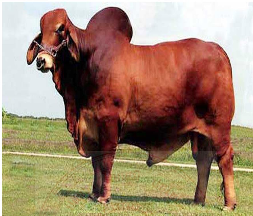
ภาพที่ ๓.๔ การเลี้ยงโคพันธุ์บราห์มัน

ชื่อเพื่อส่งเข้าโรงฆ่าสัตว์ ราคาจะแตกต่างกันขึ้นกับปริมาณโคที่ส่งเข้าจำหน่ายในท้องตลาด ถ้ามีโคส่งสู่ตลาดมากราคาก็จะถูก เพราะราคาขนาดของโคจะแตกต่างกันตามคุณภาพของขนาดตัวโค โคที่มีขนาดใหญ่จะมีราคาเมื่อเปรียบเทียบกับน้ำหนักต่อกิโลกรัมจะสูงกว่าโคที่มีขนาดเล็กและความสมบูรณ์ของโค โคที่มีความสมบูรณ์จะราคาสูงกว่าโคผอม เนื่องจากปริมาณเนื้อมากกว่าโคผอม ๑๒