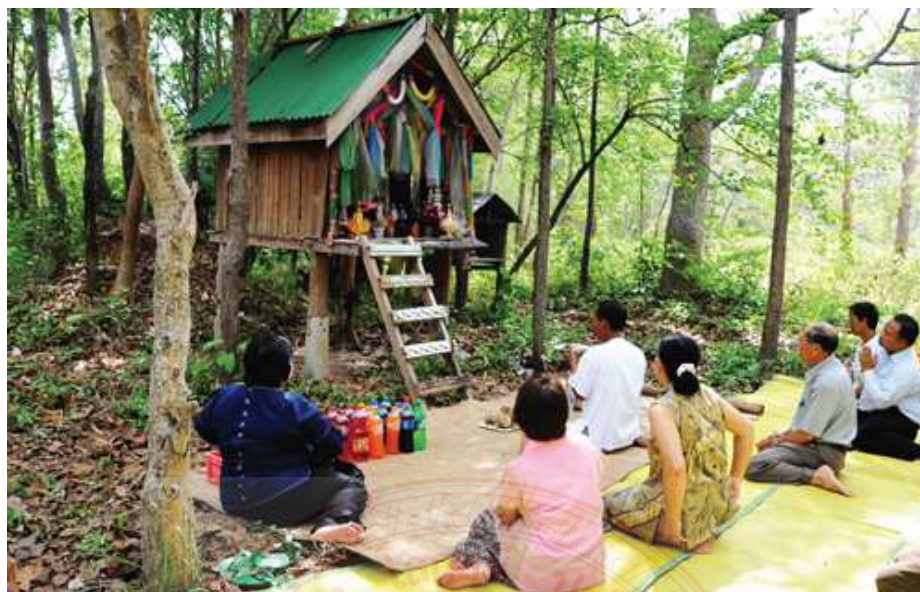
ภาพประกอบที่ ๔.๑ บวงสรวงเจ้าปู้ตา ๗

คนอีสานและคนลาวในปัจจุบันแทบทุกหมู่บ้านจะมี ดอนปู้ตา ซึ่งถือเป็นสถานที่ศักดิ์สิทธิ์ในชุมชน โดยชุมชนมีความเชื่อว่าดอนปู้ตาเป็นที่อยู่อาศัยของผีบรรพบุรุษของหมู่บ้าน ปู้ตา หมายถึง วิญญาณของบรรพบุรุษที่ล่วงลับไปแล้ว ปู้ตาเป็นวิญญาณทางพ่อ ตา เป็นวิญญาณทางแม่ คนในชุมชนจึงปลูก ตูบ หรือ หอ ให้ผีปู้ตาได้อาศัย ซึ่งอาจจะมึรูปปั้นแทนหรือไม่มีก็ได้ โดยถือว่าเป็นเขตพื้นที่ศักดิ์สิทธิ์ ผู้ใดจะรุกร้าหรือตัดต้นไม้แสดงวาจาหยาบคายไม่ได้ ดังนั้น ดอนปู้ตา จึงเป็นกลายเป็นป่าขนาดเล็กๆ และเป็นพื้นที่ป่าสงวนของคนในชุมชนไปในตัว ๘ คนอีสานและคนลาวมีความเชื่อเรื่องผีปู้ตามานานแล้ว โดยถือว่าเป็นวิญญาณของบรรพบุรุษผู้ก่อตั้งหมู่บ้าน ความเชื่อดังกล่าวได้หยั่งลึกลงไปจิตสำนึกของลูกหลานในชุมชน และถือปฏิบัติติดต่อกันอย่างเคร่งครัดสืบต่อกันมา ผีปู้ตาเป็นผู้รักษาหมู่บ้านให้ชาวบ้านอยู่เย็นเป็นสุข อีกทั้งยังมีกรบ่า (การบนบาน) หรือขอพรในกรณีต่างๆ ของคนในหมู่บ้าน ซึ่งชาวบ้านที่มาบ่าจะมีตั้งแต่เด็กนักเรียนจนถึงผู้สูงอายุทุกเพศทุกวัย การบนบานจะมีหลายอย่าง เช่น การขอพรให้ตนเองประสบความสำเร็จในด้านการเรียน ค่าขาย หรือในการเดินทาง โดยหากสิ่งที่ตนเองบ่านั้นประสบความสำเร็จ ก็จะมีการแก้บนตามที่ได้กล่าวไว้ เช่น การบ่า ด้วยหัวหมู