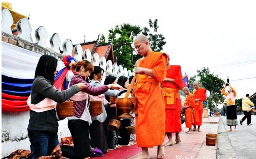
ภาพประกอบที่ ๔.๔ วิถีชีวิตกับการใส่บาตรชาวหลวงพระบาง ๓๔

การทำบุญใส่บาตร (ตักบาตร) พระสงฆ์ในตอนเช้าของชาวพุทธสายเถรวาททั่วไป ไม่ว่าจะเป็นประเทศไทย ลาว กัมพูชา และพม่า เป็นต้น ล้วนมีวิถีชีวิตแบบวิถีพุทธที่คล้ายกัน นั่นคือการทำทาน หรือการทำบุญใส่บาตรพระสงฆ์ในตอนเช้าที่พระสงฆ์ออกมารับบิณฑบาต พิธีการนี้อาจมีต่างกันบ้างในแต่ละท้องถิ่น แต่โดยเนื้อแท้ก็คือการทำบุญใส่บาตรพระสงฆ์ที่ออกโปรดสัตว์ในตอนเช้า ชาวพุทธก็จะออกมาทำบุญใส่บาตรกันเป็นประจำทุกวัน โดยเฉพาะชาวพุทธไทยอีสานและชาวพุทธลาวแล้วนั้น ถือว่าเป็นกิจวัตรประจำวันเลยทีเดียวที่จะต้องอุปถัมภ์ค้ำชูพระสงฆ์และพุทธศาสนา วิถีชีวิตจึงมีความผูกพันกับพุทธศาสนาดังที่กล่าวมาแล้ว และในงานวิจัยนี้ ผู้วิจัยใคร่นำเสนอวิถีชีวิตการทำบุญใส่บาตรพระสงฆ์ในตอนเช้าของชาวนครหลวงพระบาง ประเทศสาธารณรัฐประชาธิปไตยประชาชนลาว เพื่อเป็นกรณีศึกษาวิถีการทำบุญของชาวพุทธในปัจจุบัน ดังนี้