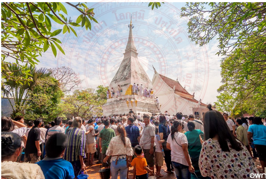
ภาพประกอบที่ ๔.๑๗ งานนมัสการพระธาตุศรีสองรักจังหวัดเลย ๑๓

ณ ปัจจุบันนี้ พระธาตุศรีสองรักยังมีอิทธิพลต่อการสร้างความสามัคคีในชุมชน สร้างความสามัคคีของคนอีสาน และการสร้างความสามัคคีระหว่างคนสองฝั่งโขง คือชาวอีสานแลชาวลาว เมื่อมีเทศกาลจะมีประชาชนทั้งคนอีสานและคนลาวมาร่วมกัน และคนที่มาร่วมงานในการไหว้พระธาตุหรือบูชาพระธาตุถือว่าเป็นเครือญาติกัน หรือเป็นพี่น้องกันคือเป็นญาติทางธรรม ถึงแม้ว่าพระธาตุศรีสองรัก ไม่ได้เป็นพระธาตุทางพระพุทธศาสนาโดยตรงและไม่ได้บรรจุพระบรมสารีริกธาตุ แต่ไม่สามารถที่แยกออกจากพระพุทธศาสนาได้เพราะคนที่สร้างนับพระพุทธศาสนา ผู้ทำพิธีกรรมก็ขาดพระพุทธศาสนาไม่ได้ ดังนั้นจึงเป็นการผสมผสานกันอย่างลงตัวระหว่าง ฝั พราหมณ์ และพระพุทธศาสนา ๑๒ ดังที่เห็นจากภาพ