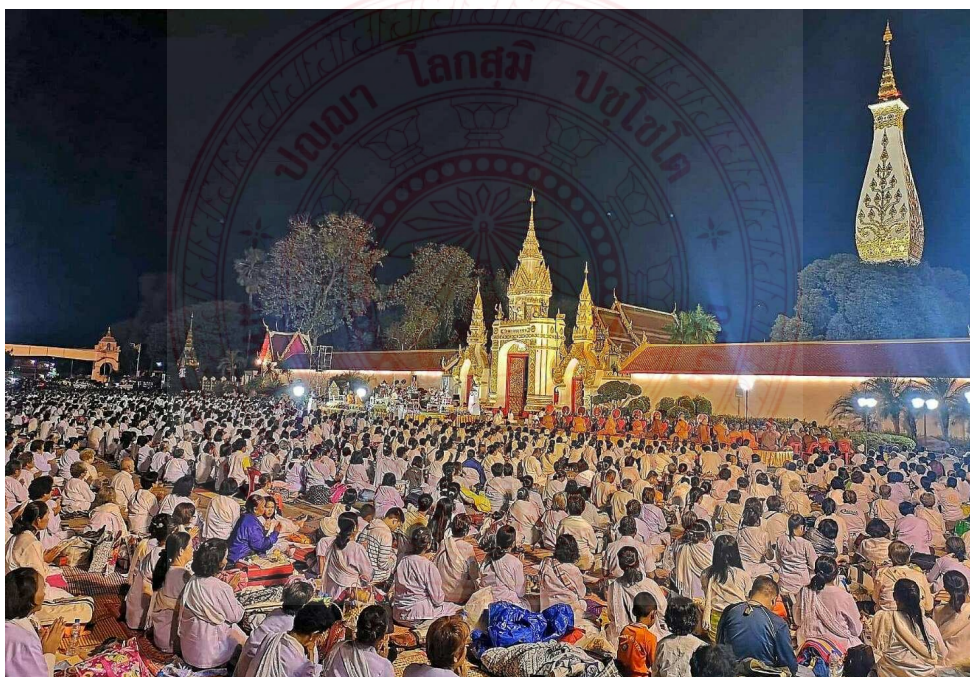
ภาพประกอบที่ ๔.๑๖ เทศกาลบูชาพระธาตุพนม ๘๙

พระธาตุพนม เป็นพระธาตุคู่บ้านคู่เมืองของอาณาจักรล้านช้าง ที่พระมหากษัตริย์และประชาชนร่วมกันสร้างขึ้น ไว้เป็นที่พึ่งทางใจและจุดศูนย์รวมจิตใจของคนล้านช้าง ซึ่งสร้างขึ้นในยุคเพื่อเป็นที่พึ่งเป็นสิ่งสร้างความสัมพันธ์ สร้างความสามัคคีระหว่างชาวพุทธสองฝั่งโขงเรื่อยมาจนถึงปัจจุบัน ๘๘ ดังที่ได้เห็นจากภาพ