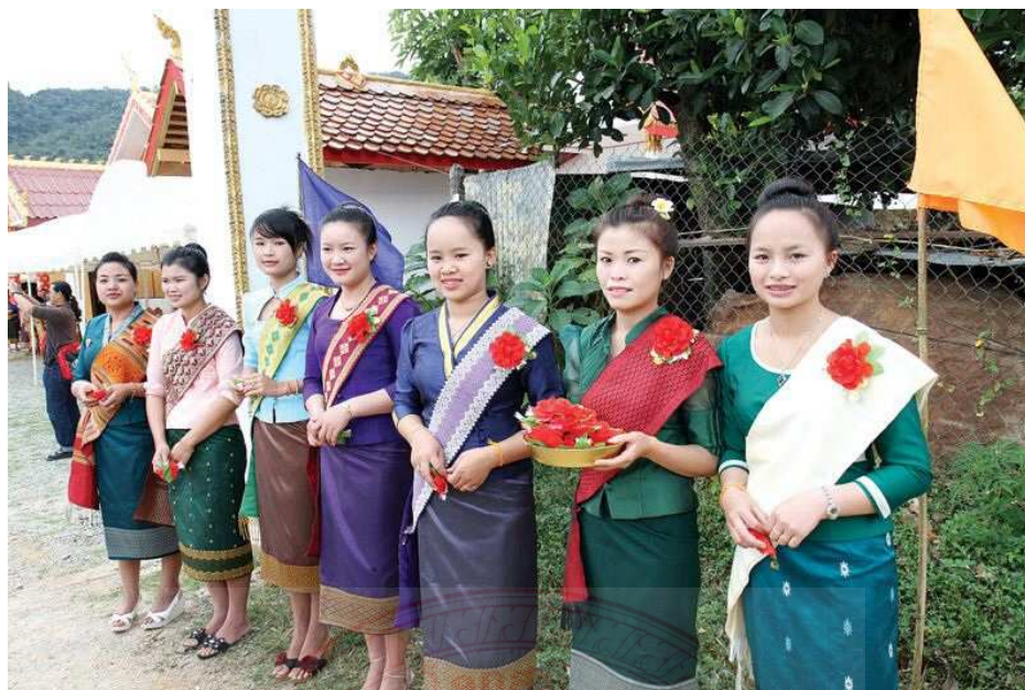
ภาพประกอบที่ ๔.๑๐ การแต่งกายของคนล้านช้าง ๕๙