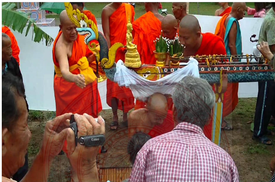
ภาพประกอบที่ ๔.๑๒ การฮอตสรงของคนอีสาน ๗๘

ประเพณี “ฮอตสรง” คือพิธีสงฆ์หรือรินน้ำแก่พระสงฆ์ ซึ่งเป็นรูปแบบประเพณีที่เก่าแก่ของผู้คนในแถบอีสาน โดยได้รับอิทธิพลมาจากอาณาจักรล้านช้าง การจัดพิธีฮอตสรงนั้นจะถูกจัดขึ้นเมื่อชาวบ้านและพระเถระในคณะสงฆ์เห็นว่า มีพระสงฆ์ที่เล่าเรียนจบในบ้นหรือชั้นต่างๆ แล้ว จึงสมควรที่จะจัดพิธีฮอตสรงให้