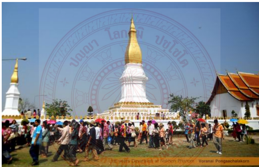
ภาพประกอบที่ ๔.๑๕ เทศกาลไหว้พระธาตุศรีโคตรบอง ๘๖

พระธาตุศรีโคตรบอง เป็นพระธาตุคู่บ้านคู่เมืองของอาณาจักรล้านช้าง ที่พระมหากษัตริย์ และประชาชนร่วมกันสร้างขึ้น ไว้เป็นที่พึ่งทางใจและจุดศูนย์รวมจิตใจของคนล้านช้าง ซึ่งสร้างขึ้นในยุคเดียวกันกับการสร้างพระธาตุพนม พระธาตุอิงฮัง พระธาตุหลวง ซึ่งพระธาตุศรีโคตรบอง เป็นที่พึ่ง เป็นสิ่งสร้างความสัมพันธ์ สร้างความสามัคคีระหว่างชาวพุทธสองฝั่งโขงเรื่อยมาจนถึงปัจจุบัน ดังที่ได้เห็นจากภาพ