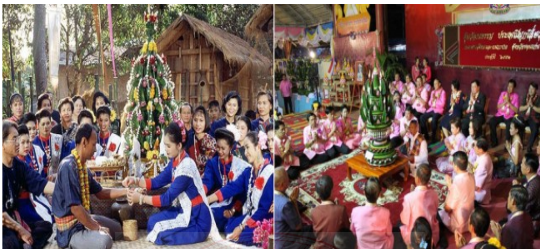
ภาพประกอบที่ ๔.๒๐ วัฒนธรรมประเพณีการผูกเสี่ยว ๙๗

การผูกเสี่ยวตามความหมายของคนล้านช้างคือ การผูกมิตรแท้ หรือเพื่อนตาย เป็นวัฒนธรรมเดิมของชาวล้านช้าง เมื่อเด็กเจริญเติบโตจะได้มีเพื่อนไปมาค้าขายด้วยกัน การเป็นเสี่ยวกันไม่ใช่จะเป็นได้ง่ายๆ ยิ่งในสมัยล้านช้างเดิมจริงๆ นั้น มีการจองเสี่ยวกันตั้งแต่อยู่ในครรภ์เลยทีเดียว การผู้เสี่ยวจะนิยมผูกชายกับชาย หญิงกับหญิง เกณฑ์การผูกเสี่ยวก็โดยที่คู่เสี่ยวมีหน้ามีตาคล้ายกัน เกิดปีเดียวกัน มีรสนิยมเหมือนกัน บิดามารดายินยอมหรือเห็นดีด้วย บางทีลูกไม่ได้เห็นหน้ากัน แต่บิดามารดาตกลงกันแล้วผูกเป็นเสี่ยวกันก็มี วัฒนธรรมการผูกเสี่ยวนี้จะนิยมทำกันในหลายพื้นที่ โดยเฉพาะในภาคอีสานนั้นค่อนข้างจะนิยมผูกเสี่ยวกันเป็นพิเศษ อย่างเช่น ในจังหวัดขอนแก่นจะมีงานประเพณีผูกเสี่ยว ซึ่งจะจัดขึ้นเป็นประจำทุกปีในช่วงเดือนพฤศจิกายน หรือธันวาคม ๙๘ จะเห็นได้ว่า วัฒนธรรมการผูกเสี่ยวนี้เป็นวัฒนธรรมที่ดั้งเดิม อันแสดงให้เห็นถึงความสัมพันธ์ของคนในสังคมที่จะต้องมีการเกื้อกูลต่อความเป็นอยู่ของกันและกัน และมีผลต่อความมั่นคงของชาติและสร้างความเป็นปึกแผ่นให้แก่สังคมได้อย่างดียิ่ง