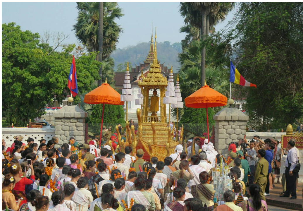
ภาพประกอบที่ ๔.๑๘ พิธีทรงนำพระบาง ๙๕

พระบาง ถ้าใครได้ทรงนำพระบางถือว่าเป็นสิริมงคลต่อชีวิตทำให้ชีวิตพบแต่ความร่มเย็น มีความสุข มีความเจริญ ๙๔ ดังที่เห็นดังภาพ