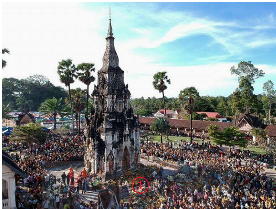
ภาพประกอบที่ ๔.๑๓ งานนมัสการพระธาตุอุโมงค์ ๕๒