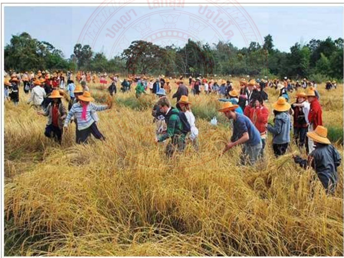
ภาพประกอบที่ ๔.๒๑ ประเพณีการลงแขกเกี่ยวข้าวของอีสาน ๑๐๐

โดยไม่คิดค่าแรง ซึ่งในสมัยก่อนชาวล้านช้างจะช่วยกันปลูกบ้านสร้างเรือน ทำไร่ ทำนา และทำบุญสุนทานต่างๆ โดยเฉพาะการทำนา การปลูกบ้าน การนวดข้าว ถือว่าเป็นกิจกรรมที่แสดงออกถึงการช่วยเหลือเกื้อกูลกันอย่างแท้จริง ถ้าใครปลูกบ้านก็จะไปขอแรงชาวบ้านมาช่วย โดยเจ้าตัวจัดอาหารกินไว้คอยต้อนรับ ทำให้การปลูกบ้านเสร็จภายในวันเดียว หรือมากกว่านั้นนิดหน่อย ไม่ได้ใช้เวลาเหมือนทุกวันนี้ การทำนา ไม่ว่าจะเป็นการปักดำนา หรือการนวดข้าว ก็ใช้วิธีลงแขกด้วยเช่นกัน หากใครยังไม่เสร็จทันฤดูกาลก็จะไปช่วยกันทำให้เสร็จ ตัวไปไม่ได้ก็จะส่งลูกหลานหรือคนเกี่ยวข้องไปแทน แม้บางครั้งลูกหลานไปไม่ได้ก็จะส่งวัวควายไปช่วยไถ ช่วยคลาด และช่วยนวดข้าวในลานแทน ๙๙ ซึ่งก็นับว่าเป็นความสามัคคีและความเห็นอกเห็นใจกันที่จะหาที่ได้อื่นอีกไม่ได้แล้ว นอกจากสังคมล้านช้าง ซึ่งปัจจุบันแม้จะมีการสืบทอดมาระยะหนึ่ง แต่ทุกวันนี้วัฒนธรรมการลงแขกก็เริ่มจะหายไปจากสังคมอีสานแล้ว เพราะความเจริญทางเทคโนโลยีทำให้วัฒนธรรมการลงแขกลดลงและหายไปที่สุดในที่สุด