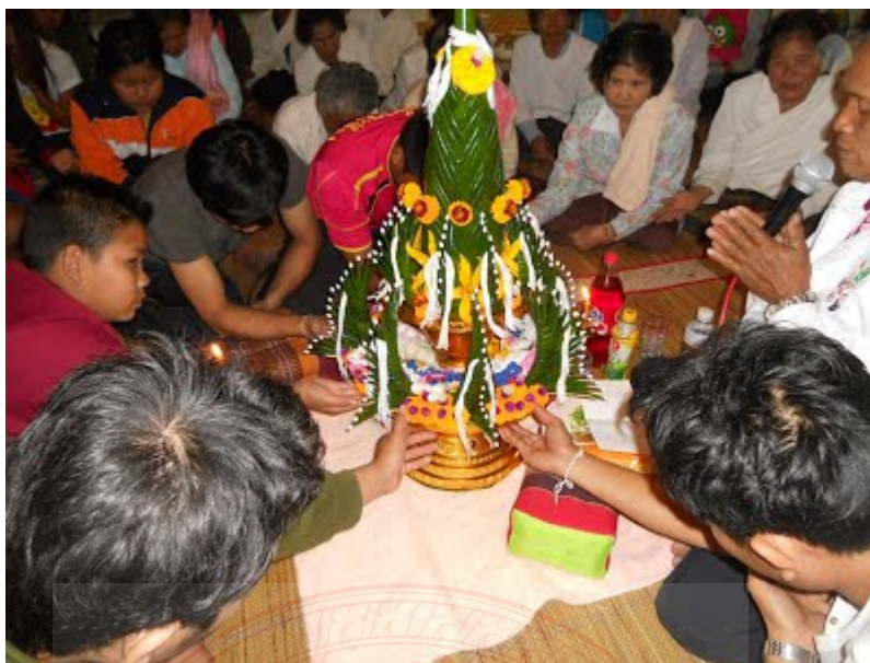
ภาพประกอบที่ ๔.๓ พิธีการสู่ขวัญของคนอีสาน ๒๔

พิธีกรรมการสู่ขวัญของคนอีสานและคนลาว ที่เห็นว่ามีศาสนาพราหมณ์-ฮินดูเข้ามาเกี่ยวข้องด้วยก็ตรงที่ได้รับอิทธิพลทางแนวคิดมาจากคติความเชื่อของพราหมณ์ นั่นคือการนำใบตองมาประดิษฐ์บายศรี เนื่องด้วยใบตองนั้นเป็นของสะอาดบริสุทธิ์ไม่มีมลทินของอาหารเก่าให้แปดเปื้อน และอีกประการหนึ่งก็คือ รูปร่างลักษณะของบายศรีที่ได้จำลองมาจากเขาพระสุเมรุซึ่งเป็นที่สถิตของพระศิวะหรือพระอิศวร ตลอดจนเครื่องสังเวทียังมีความเชื่อว่ามีที่มาจากคติพราหมณ์เช่นกัน เช่น ไข่แดงกวาง มะพร้าว รวมถึงพิธีกรรมอื่นๆ เช่น การเวียนเทียน และการเจิม เป็นต้น ซึ่งพิธีกรรมต่างๆ เหล่านี้พราหมณ์เป็นผู้ประกอบพิธีทั้งสิ้น ๒๕ แม้ในปัจจุบันจะไม่มีผู้ที่เป็นพราหมณ์จริงๆ ในสังคมชาวบ้านทั่วไป แต่ผู้ที่ทำพิธีสู่ขวัญ (สูตรขวัญ) ก็จะต้องเป็นผู้ที่สังคมให้ความเคารพนับถือทั้งคุณวุฒิและวัยวุฒิ โดยจะต้องมีคุณลักษณะที่เหมาะสมกับการเป็นพราหมณ์ นั่นคือมีอายุประมาณ ๕๐ ปีขึ้นไป ต้องรักษาศีล ๘ หรืออย่างน้อยก็ต้องรักษาศีล ๕ อยู่เนื่องเนติย งดเว้นอบายมุขทั้งหลาย เป็นผู้ที่มีบุคลิกดี เสียงดี ท่วงทิวาจาน่าเคารพเชื่อถือ ต้องเป็นผู้ที่มีความสามารถในการท่องบทสู่ขวัญและคำอวยพรที่เกี่ยวข้องได้อย่างแม่นยำและน่าฟัง และที่สำคัญที่ขาดไม่ได้คือการแต่งชุดขาวที่มีลักษณะ