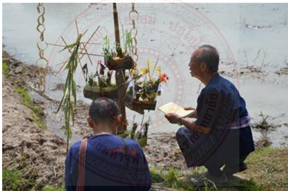
ภาพประกอบที่ ๔.๒ การบูชาผีตาแฮกหรือผีประจำไร่นา ๑๒

ผีตาแฮก เป็นผีประจำไร่นา ผีนา บ้างที่เรียกว่าเจ้าแม่โพสพ ซึ่งชาวไทยอีสานและชาวลาวเรียกว่า ผีตาแฮก ปูแฮก หรือแม่ธรณี คนสมัยล้านช้างเชื่อว่าเป็นผีที่ทำหน้าที่อารักขาผืนนาคอยดูแลให้ข้าวกล้า น้ำท่า รวมถึงปูปลาให้อุดมสมบูรณ์ คุ่มครองสัตว์เลื้อยต่างๆ ไม่ให้เกิดโรคร้าย ผีตาแฮกจะสถิตอยู่มุมใดมุมหนึ่งของที่นา โดยเจ้าของนาจะทำศาลเพียงตาเล็กๆ ไว้ ก่อนจะลงทำนาจะต้อง