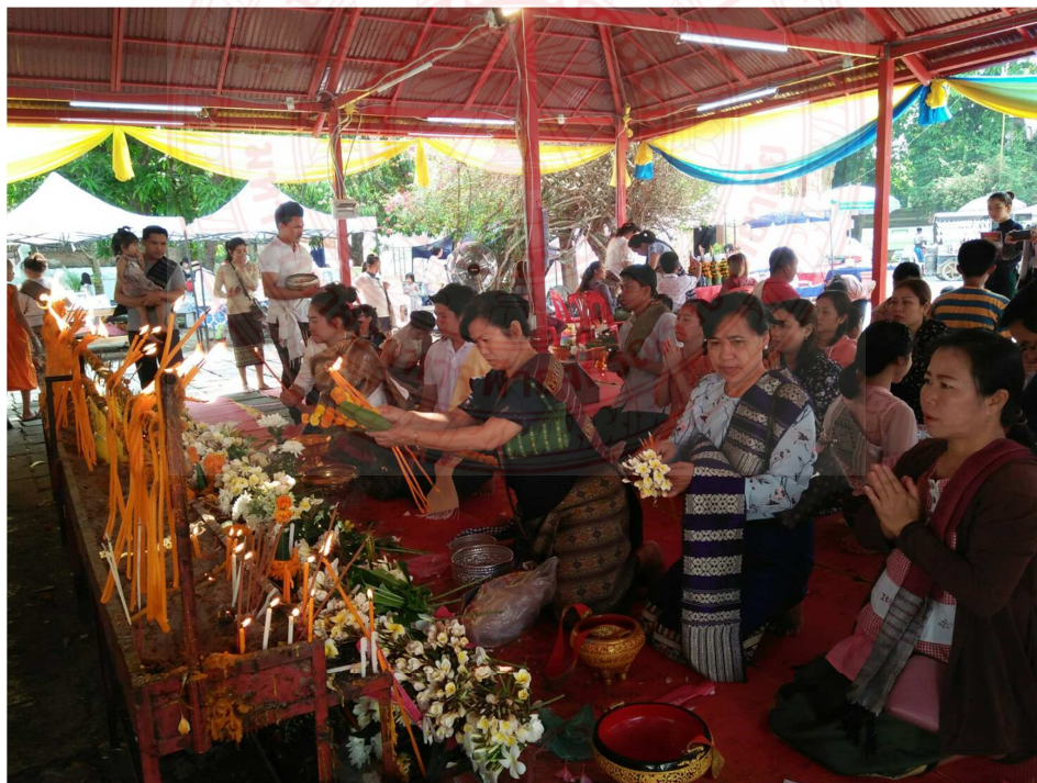
คณะผู้วิจัยร่วมงานบุญประเพณีทอดสงฆ์ ที่วัดพระโอ สปป. ลาว ซึ่งเป็นประเพณีเก่าแก่ที่ได้รับอิทธิพลมาจากสมัยล้านช้าง