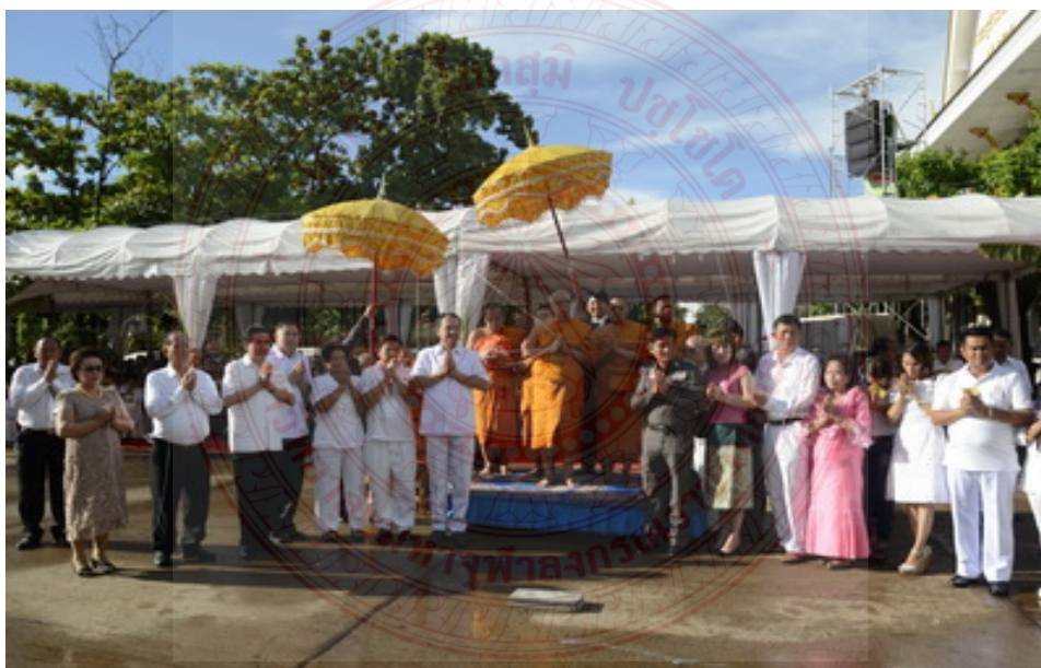
ภาพประกอบที่ ๔.๑๙ พิธีหล่อพระเจ้าน้องคำต่อจำลองที่วัดศรีชมพูน้องคำต่อจังหวัดหนองคาย ๙๖

พระเจ้าน้องคำต่อจะมีอิทธิพลต่อการสร้างความสามัคคีของคนลาวและคนอีสานมาก จึงทำให้พระเจ้าน้องคำต่อได้รับความนิยม ในการสร้างจำลองไว้สักการบูชาในวันที่สำคัญๆ ของอีสาน เช่น พระเจ้าน้องคำต่อวัดศรีชมพูน้องคำต่อ หนองคาย พระเจ้าน้องคำต่อที่อุบล พระเจ้าน้องคำต่อที่ชัยภูมิ เป็นต้น สำหรับการสร้างพระเจ้าน้องคำต่อนั้นต้องอาศัยแรงศรัทธาของคนจำนวนมากและอาศัยความสามัคคีจึงจะสร้างสำเร็จ เพราะเป็นพระพุทธรูปองค์ใหญ่ เช่น การหล่อพระเจ้าน้องคำต่อจำลอง ที่วัดศรีชมพูน้องคำต่อ อ.ท่าบ่อ จ.หนองคาย โดยมี ดร. มหาพอง สมะเล็ก สมเด็จพระสังฆราช สปป.ลาว ร่วมพิธีเททองหล่อนำฤกษ์พระพุทธรูปจำลองหลวงพ่องค์ต่อ ซึ่งจะมีทั้งประชาชนและพระสงฆ์จากฝั่งอีสานและฝั่งลาวเข้าร่วมพิธีด้วยแรงศรัทธา เป็นการนำมาซึ่งความสามัคคีของชุมชนและของคนสองฝั่งโขง