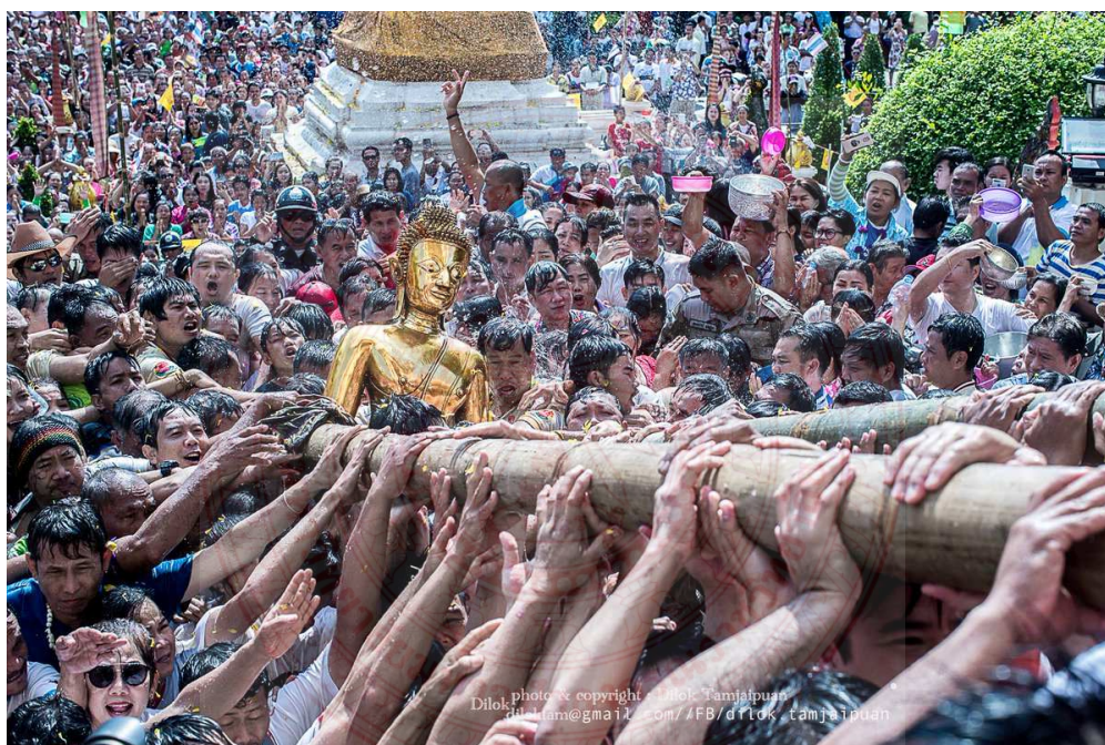
ภาพประกอบที่ ๔.๖ อิทธิพลของหลวงพ่พระใสต่อวิถีชีวิตของคนอีสานและคนลาว ๕๓

ในเทศกาลสงกรานต์ชาวอีสานและชาวลาวยังคงมีความเชื่อที่มั่นคงต่อพระพุทธศาสนาเรื่อยมาจนถึงปัจจุบัน เช่น ประเพณีสงกรานต์ การเล่นสงกรานต์ หรือการสาดน้ำสงกรานต์ อันดับแรกจะเริ่มจากการนำพระพุทธรูปมาสงกราน้ำ หลังจากนั้นก็จะเป็นการสงกราน้ำผู้หลักผู้ใหญ่ แล้วจึงจะเล่นน้ำหรือสาดน้ำกันตามประเพณี ปราภฏการณของการทำบุญสงกรานต์คือการเอาพระคู่บ้านคู่เมืองมาสงกราน้ำ โดยเฉพาะหลวงพ่พระใส ที่จังหวัดหนองคาย เป็นปราภฏการที่นำอัศจรรย์ มีคนจำนวนเป็นแสนคนที่มาจากทั่วสารทิศหลั่งไหลมาสงกราน้ำพระหลวงพ่พระใส ดังภาพ