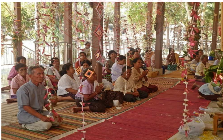
ภาพประกอบที่ ๔.๗ การเทศมหาชาติพระเวสสันดรชาดก ของคนอีสาน ๕๔

ภาพกิจกรรมฝาผนังที่มีอิทธิพลต่อกิจกรรมฝาผนังของคนอีสานและคนลาว ถ้าเราไปดูภาพกิจกรรมฝาผนังในปัจจุบันแล้ว ส่วนมากจะเป็นเรื่องราวพระเวสสันดร พระเวสสันดรจะอิทธิต่อวิถีชีวิตของคนอีสานและคนลาว เพราะเป็นหนึ่งในประเพณี สิบสองเดือน คือพอถึงเดือนสี่จะมีการทำบุญพระเวส และมีการมหาชาติพระเวสสันดรชาดก และคนอีสานและคนลาวยังเชื่อว่าถ้าใครได้ฟังเทศพระเวสสันดรชาดก จนครบทุกกัณฑ์ เมื่อตายไปแล้วจะได้ไปสู่สุคติสุข