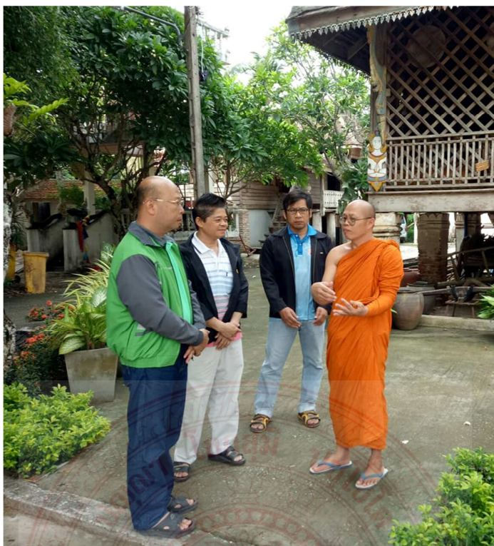
ลงพื้นที่เก็บข้อมูลเกี่ยวกับพระธาตุศรีสองรัก อำเภอด่านซ้าย จังหวัดเลย และความเชื่อของคนอำเภอด่านซ้ายเกี่ยวกับผีตาโขน ซึ่งความเชื่อนี้กลายมาเป็นประเพณีที่มีชื่อเสียงของคนอำเภอด่านซ้าย จังหวัดเลย