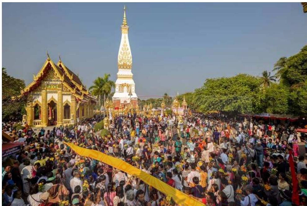
ภาพประกอบที่ ๔.๕ ประเพณีการห่มผ้าพระธาตุพนม ๕๑

อิทธิพลของสถาปัตยกรรมสมัยล้านล้าน ที่มีอิทธิพลต่อวิถีการดำเนินชีวิตของคนอีสาน และคนลาว ในปัจจุบันเป็น เช่น พระธาตุพนม พระธาตุหลวง พระธาตุศรีสองรัก เจดีย์วัดหนองแขวง จังหวัดขอนแก่น เจดีย์วัดผาน้ำน้อย จังหวัดร้อยเอ็ด ล้วนแล้วแต่เป็นสิ่งที่ป็นศูนย์รวมจิตใจและเป็นที่พักทางจิตใจของชาวพุทธอาน และชาวพุทธอีสานและชาวพุทธลาว ดังภาพประกอบ