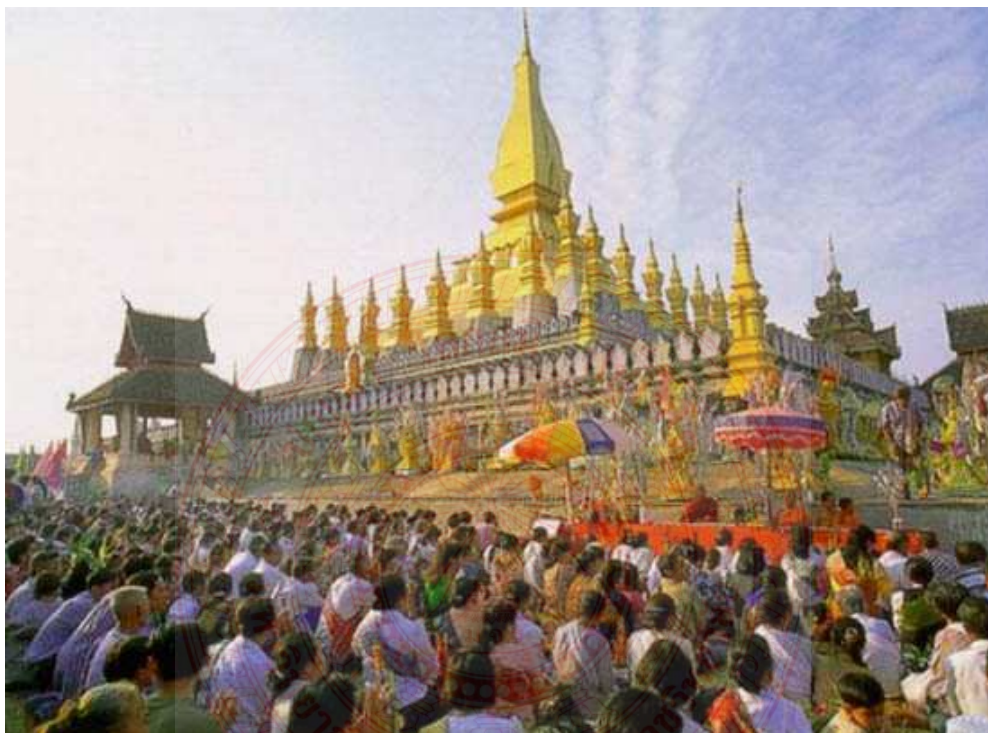
ภาพประกอบที่ ๔.๑๔ งานนมัสการพระธาตุหลวง เวียงจันทน์ ๕๕

สร้างครอบพระธาตุองค์เก่า เมื่อสร้างพระธาตุหลวงเสร็จแล้ว จึงทรงขนานนามพระธาตุนี้ว่า พระธาตุเจดีย์โลกจุฬามณี หรือพระธาตุหลวง ซึ่งพระธาตุหลวงนั้นเป็นพระธาตุคู่บ้านคู่เมืองของอาณาจักรล้านช้าง เป็นพระธาตุที่สร้างด้วยแรงศรัทธาของพระมหากษัตริย์และประชาชนทุกหมู่คนสองฝั่งโขงให้ความเคารพ นับถือเป็นอย่างมาก ถือว่าเป็นจุดศูนย์รวมทางด้านจิตใจของคนในสมัยอาณาจักรล้านช้างและยังมีอิทธิพลเรื่อยมาจนถึงปัจจุบันอย่างไม่มีวันจางหาย ๕๔