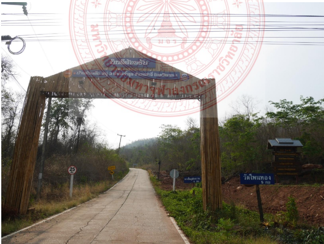
ทางเข้าสถานปฏิบัติธรรมในการจัดกิจกรรม