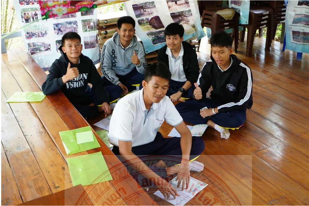
กิจกรรมการสื่อความหมายและอธิบายเหตุผลของเยาวชน