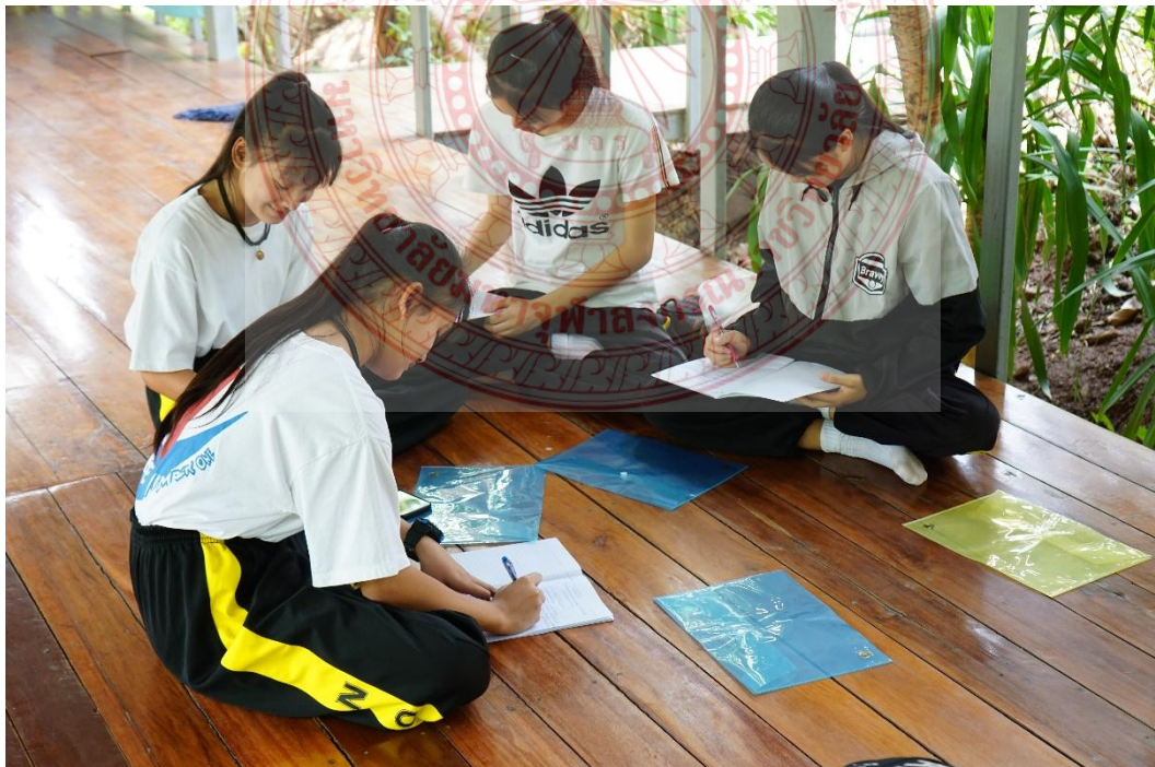
กิจกรรมการสื่อความหมายและอธิบายเหตุผลของเยาวชน