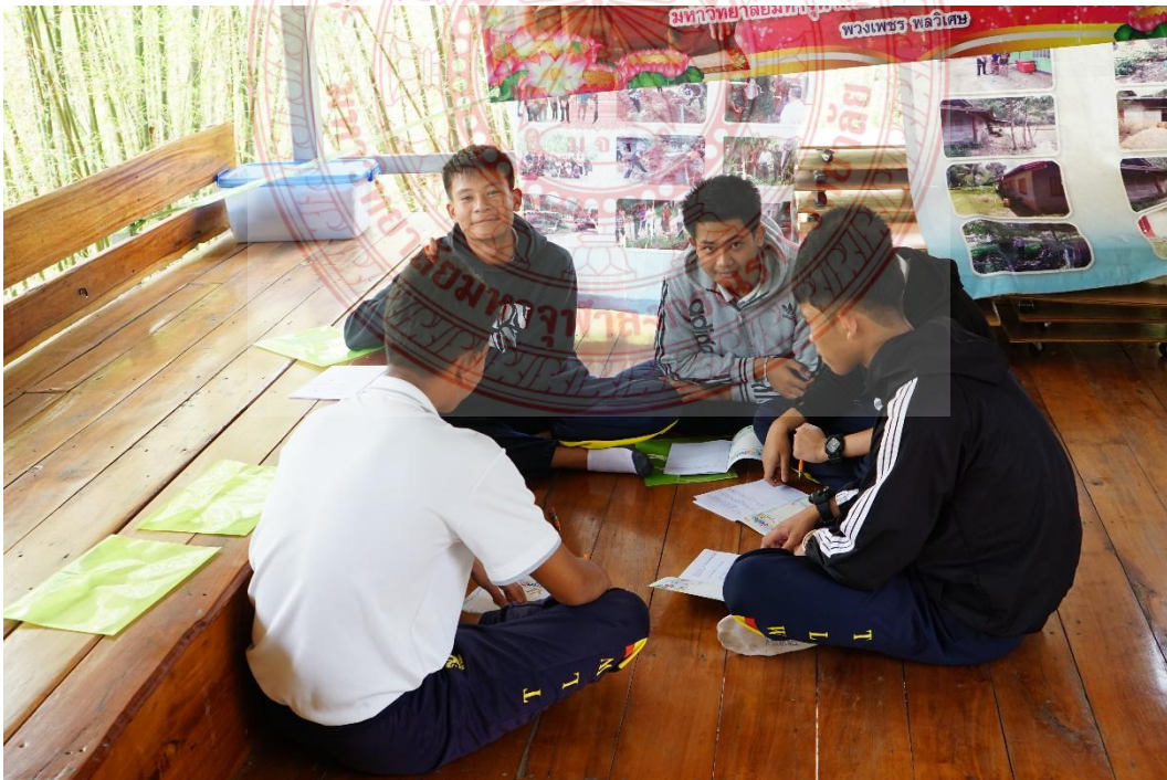
กิจกรรมการสื่อความหมายและอธิบายเหตุผลของเยาวชน