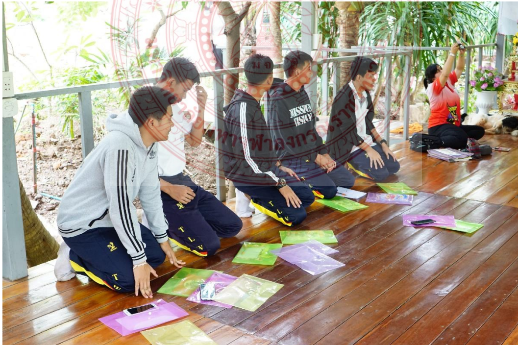
กิจกรรมการสวดมนต์ไหว้พระ