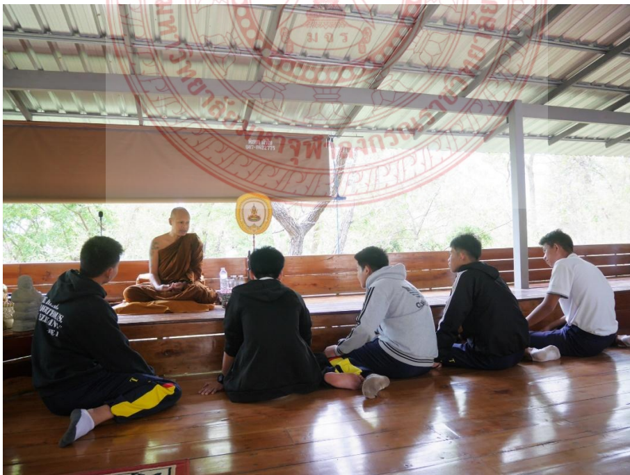
ภาพที่ ๔.๒ พระสงฆ์ผู้ส่งสารอธิบายถึงความสำคัญของการสวดมนต์ไหว้พระ