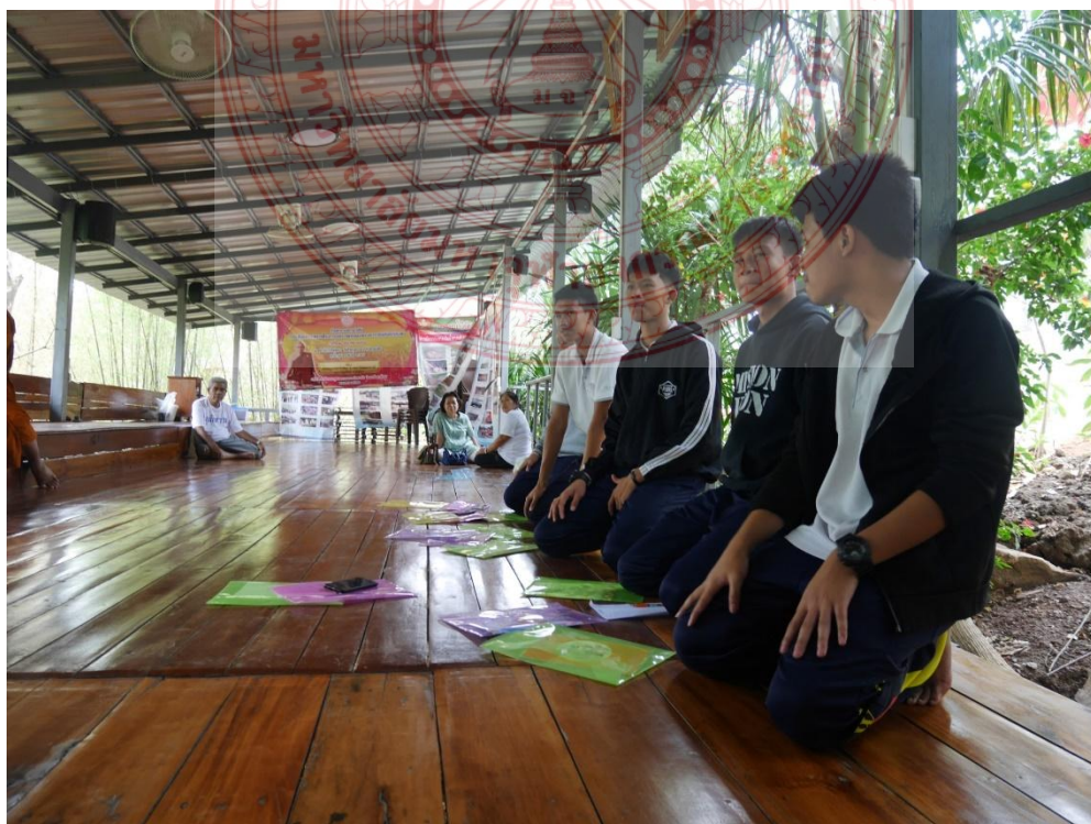
กิจกรรมการฝึกสมาธิ