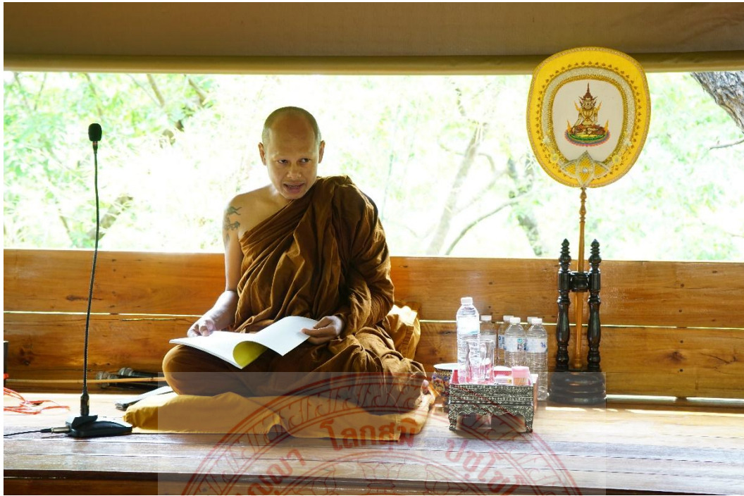
พระสงฆ์ผู้สังสารอธิบายถึงความเป็นมาของการสวดมนต์ไหว้พระ