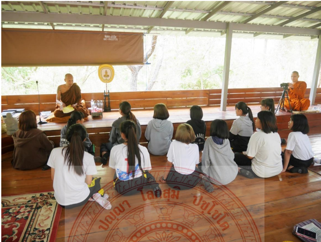
กิจกรรมและการสื่อความหมายหลักพระพุทธศาสนา