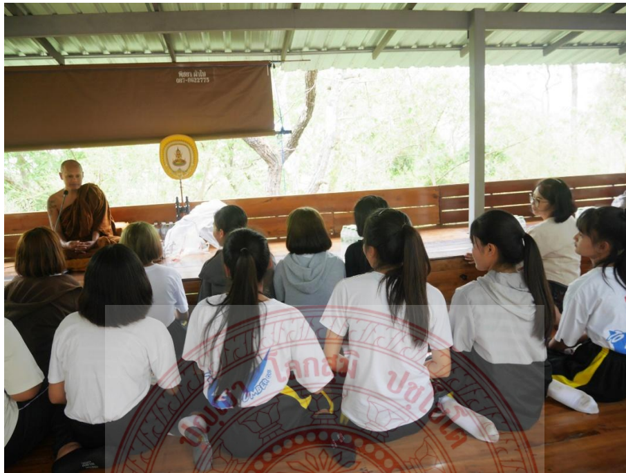
ภาพที่ ๔.๑ พระสงฆ์ผู้ส่งสารอธิบายถึงความเป็นมาของการสวดมนต์ไหว้พระ