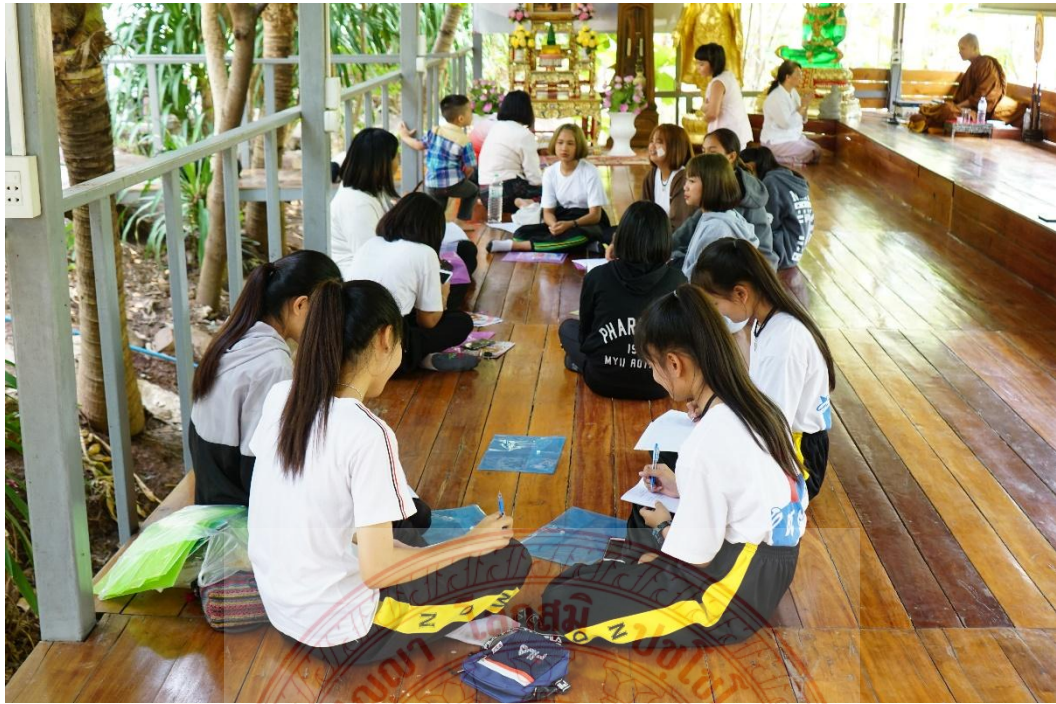
กิจกรรมการสื่อความหมายและอธิบายเหตุผลของเยาวชน