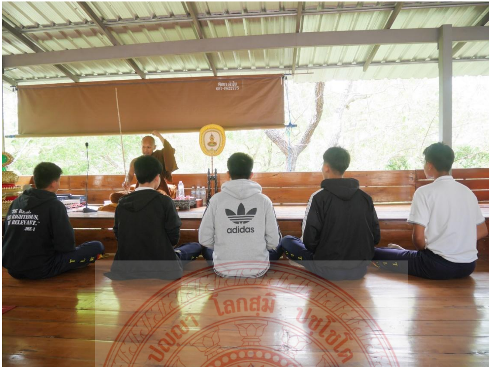
กิจกรรมการฝึกสมาธิ