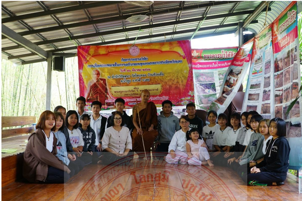
กิจกรรมการสื่อความหมายและอธิษฐานเหตุผลของเยาวชนจังหวัดเลย