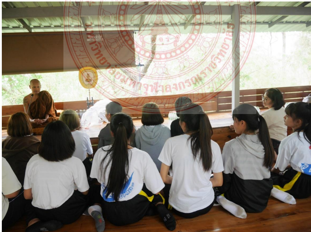
กิจกรรมและการสื่อความหมายหลักพระพุทธศาสนา