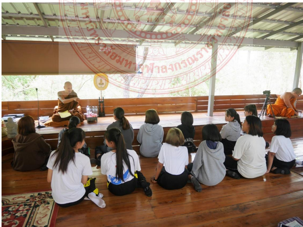
กิจกรรมและการสื่อความหมายหลักพระพุทธศาสนา