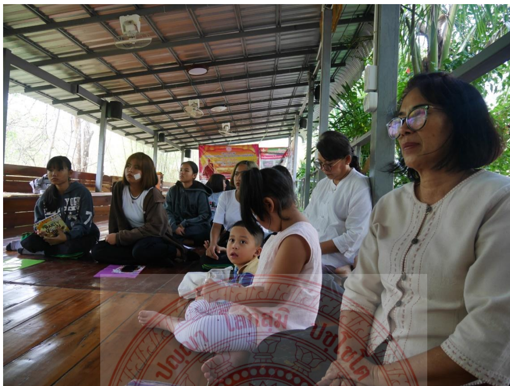
กิจกรรมการฝึกสมาธิ