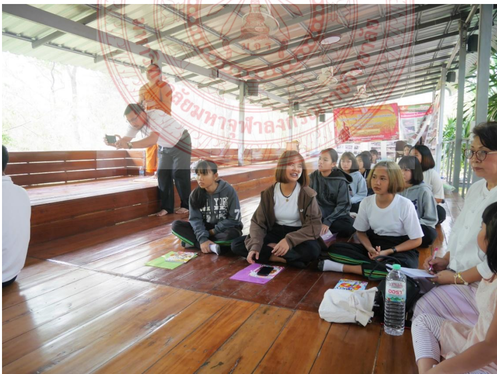
กิจกรรมการฝึกสมาธิ