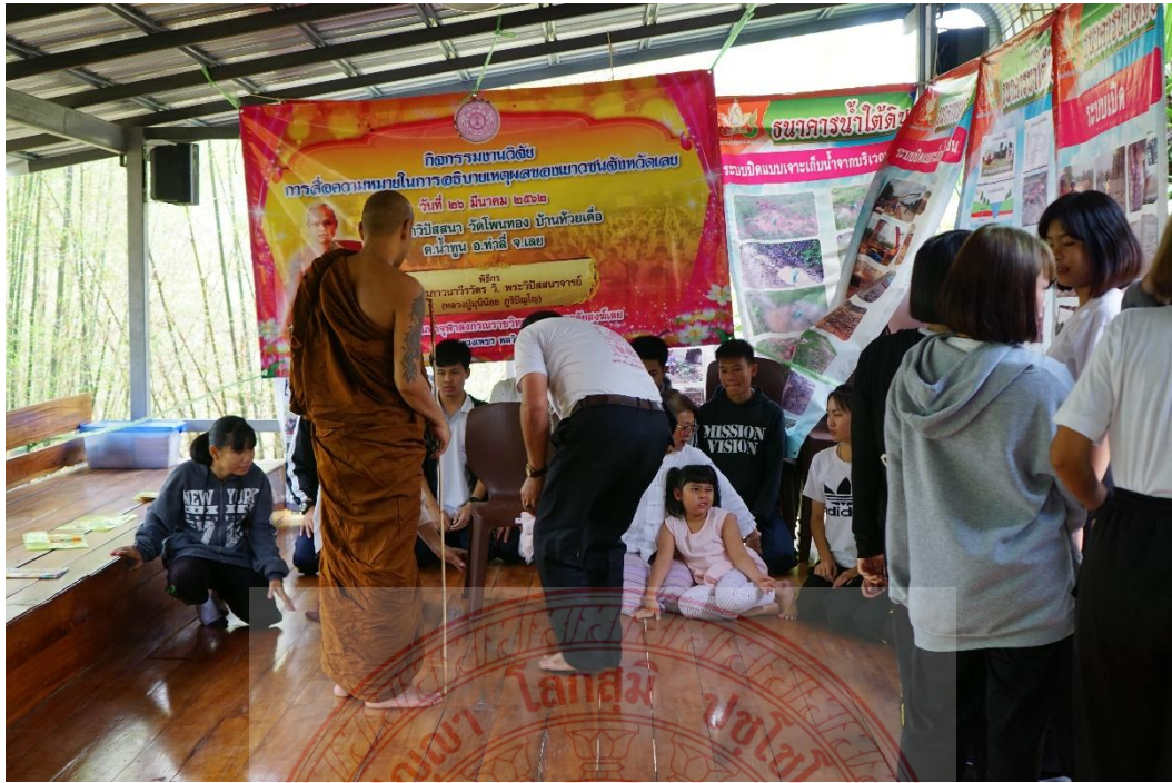
กิจกรรมและการสื่อความหมายหลักพระพุทธศาสนา