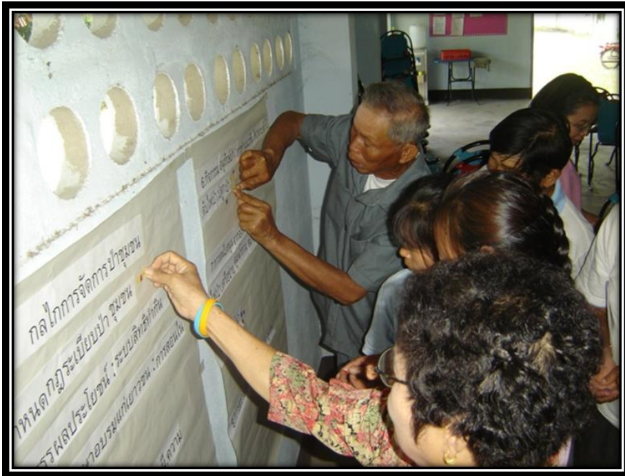
การวิเคราะห์สภาพการใช้ภูมิปัญญาในการอนุรักษ์ป่าชุมชน