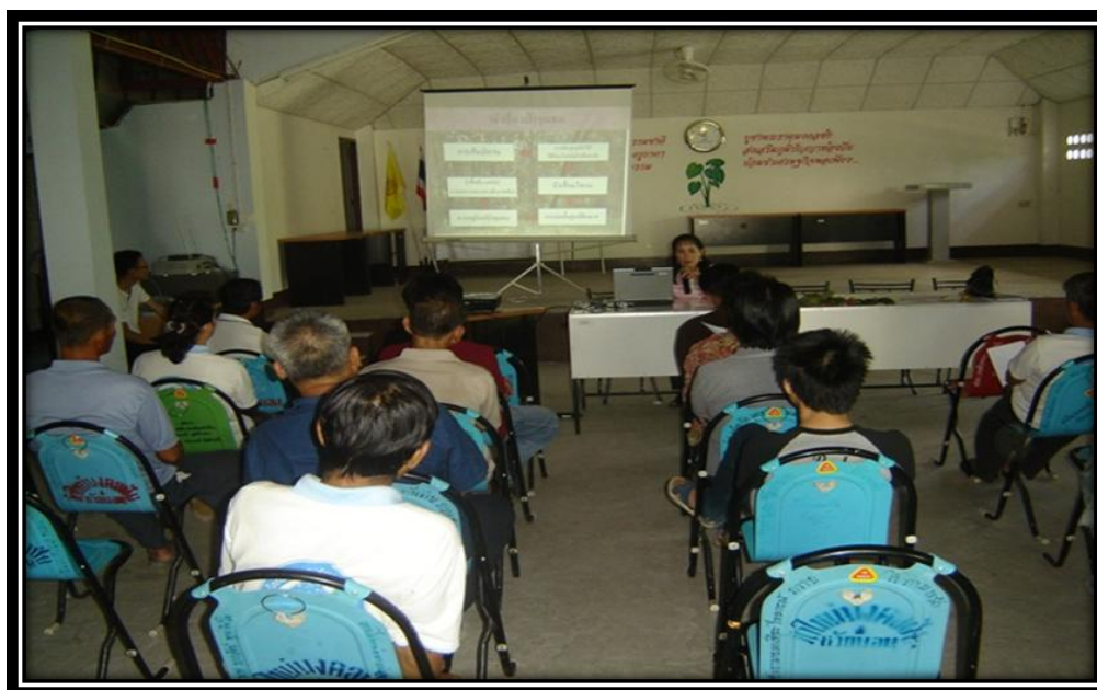
การทบทวนและวิเคราะห์แนวทางการจัดการความรู้การใช้ภูมิปัญญาในการอนุรักษ์ป่าชุมชน