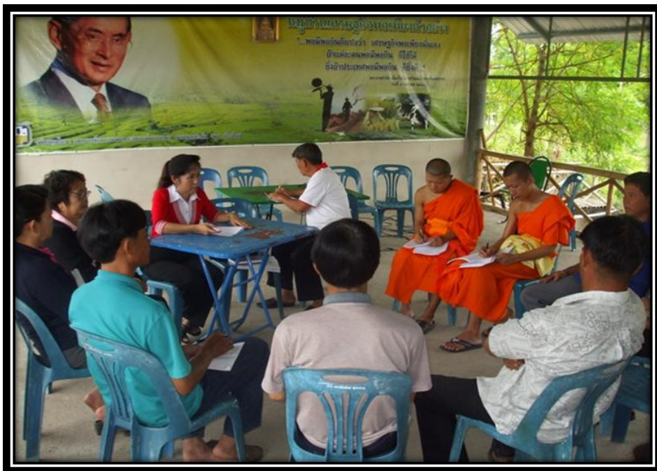
การสนทนากลุ่มการใช้ภูมิปัญญาในการอนุรักษ์ป่าชุมชน