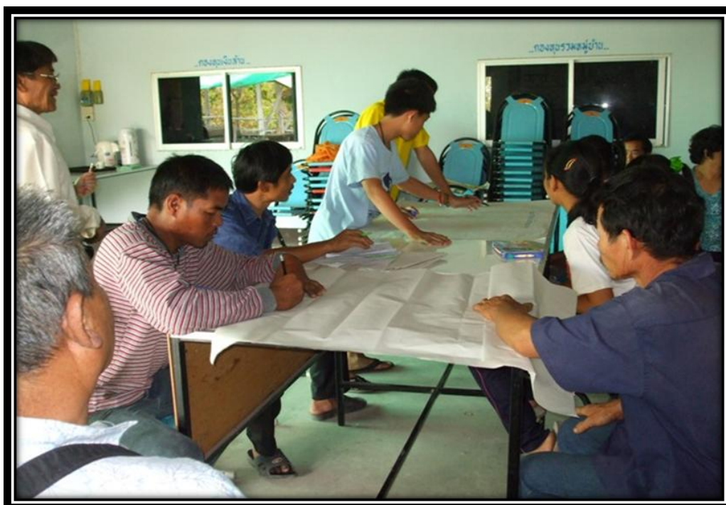
เยาวชนและผู้ใหญ่ร่วมเรียนรู้การอนุรักษ์ป่าชุมชน