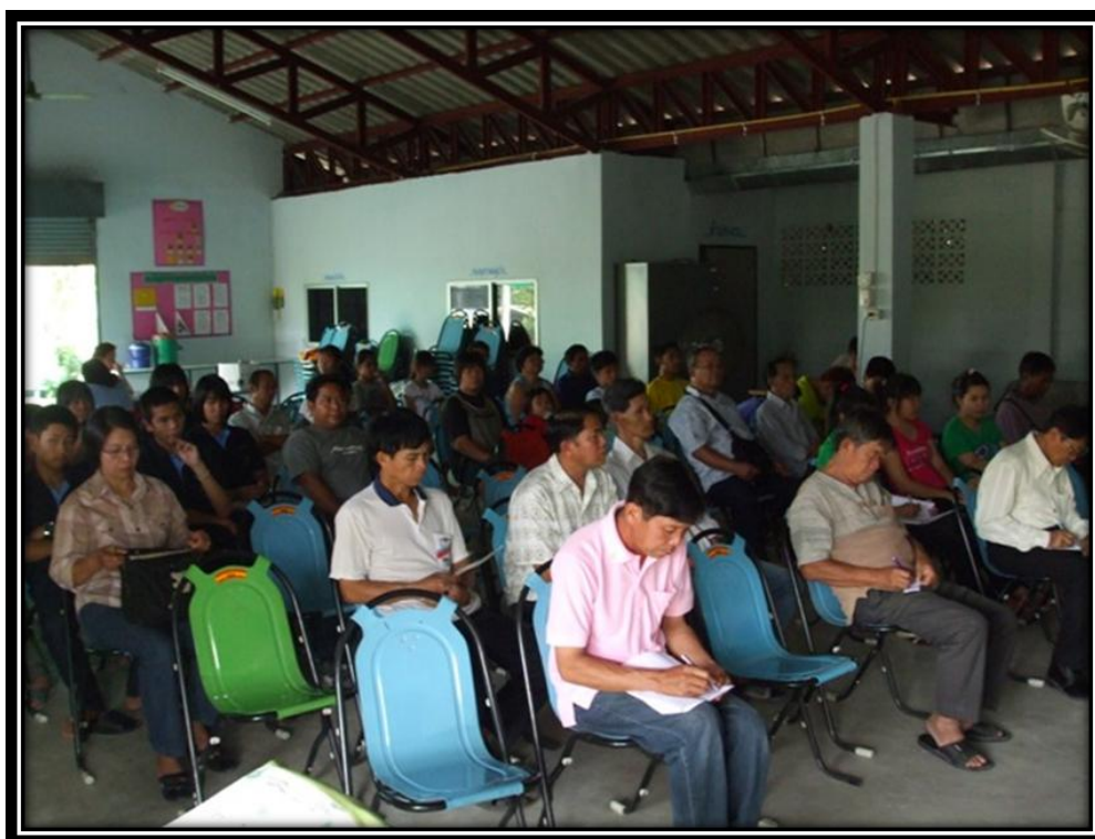
เวทีสรุปบทเรียน