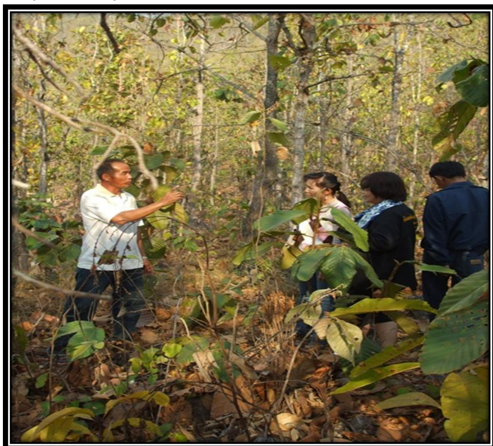
การรวบรวมองค์ความรู้ภูมิปัญญาการอนุรักษ์ป่าชุมชน