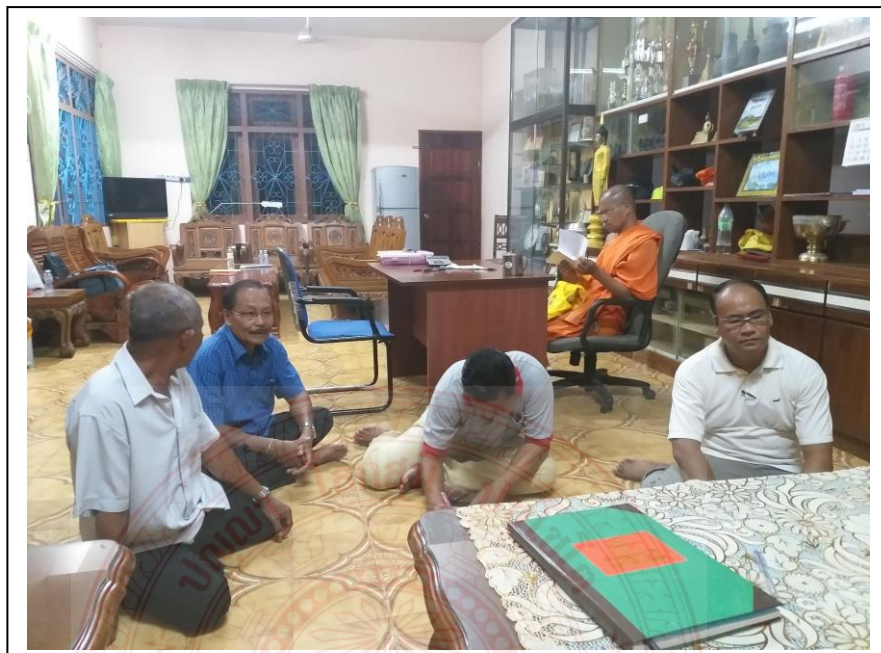
การสัมภาษณ์ไวยาวัจกรภายในวัดบุญญาราม ประเทศมาเลเซีย