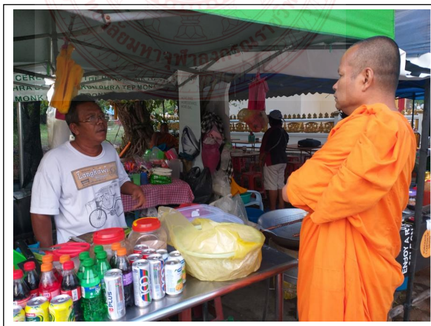
สัมภาษณ์ประชาชนผู้ค้าขายในเขตบริการของวัดบุญญาราม