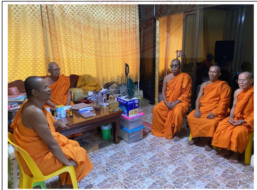
ประชุมเพื่อปรึกษาแลขอข้อมูลจากคณะสงฆ์วัดหนองป่าตอสามัคคีธรรม จังหวัดสุโขทัย