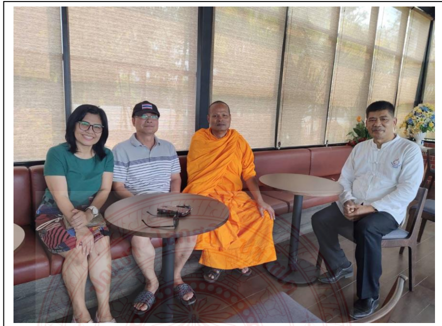
การสัมภาษณ์ผู้ที่เกี่ยวข้องกับ ภาคประชาชน เจ้าหน้าที่รัฐ