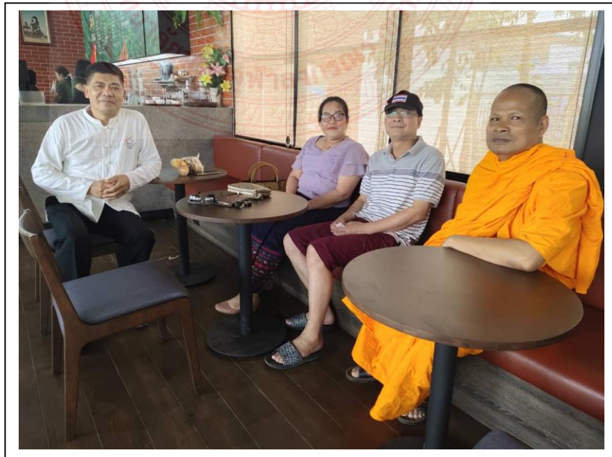
ประชุมผู้ที่เกี่ยวข้องกับ สนทนาปรึกษา แลกเปลี่ยนความคิดและเก็บข้อมูล