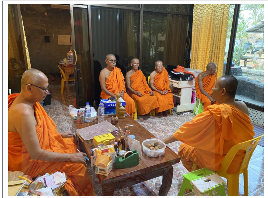
สัมภาษณ์เจ้าอาวาส ณ วัดหนองป่าตอสามัคคีธรรม จังหวัดสุโขทัย