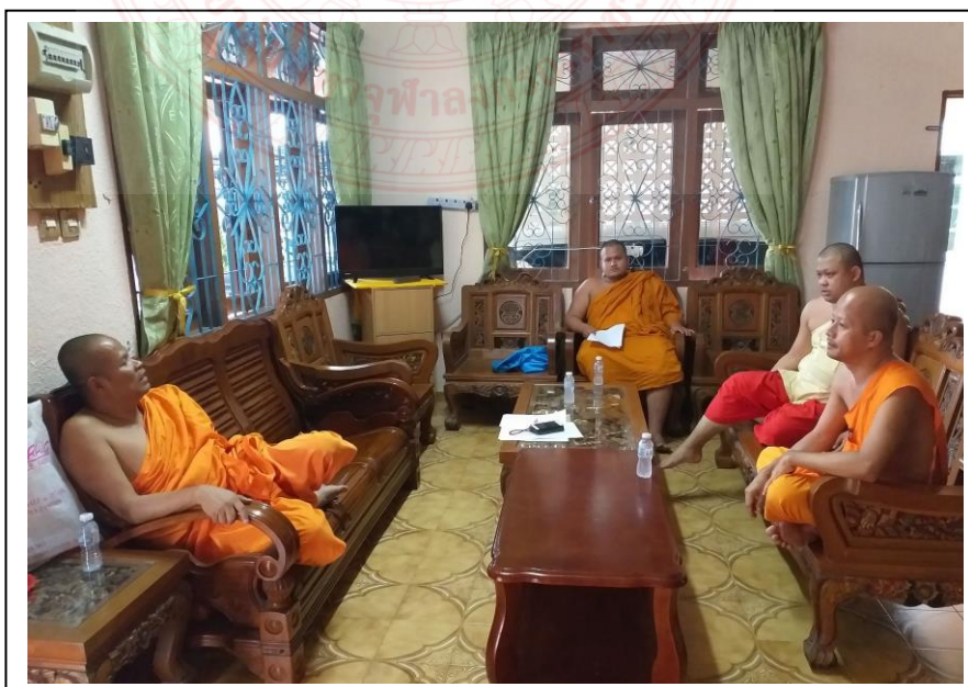
การสัมภาษณ์พระภิกษุภายในวัดบุญญาราม ประเทศมาเลเซีย