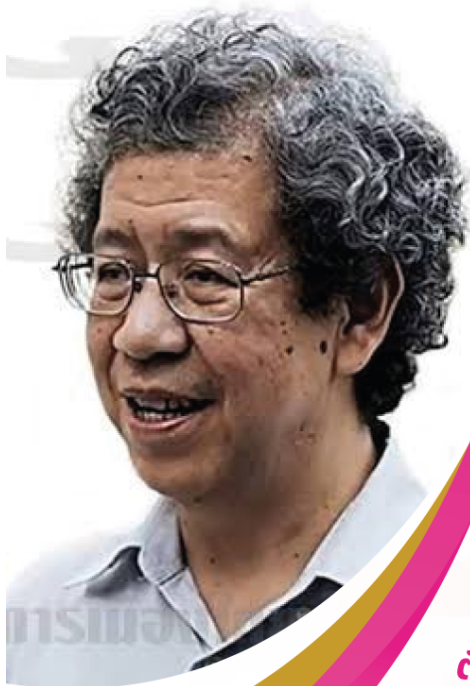
ตัวอย่าง ผลงานวิชาการ