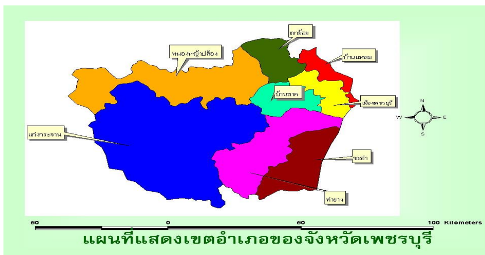
รูปที่ 3 แผนที่จังหวัดเพชรบุรี

ทางด้านทิศตะวันตกในเขตอำเภอแก่งกระจานและอำเภอหนองหญ้าปล้อง มีลักษณะเป็นที่ราบสูงและภูเขาสูงชัน แล้วค่อย ๆ ลาดต่ำมาทางทิศตะวันออกเกิดเป็นสันปันน้ำ แบ่งน้ำส่วนหนึ่งให้ไหลลงสู่ประเทศพม่าและอีกส่วนหนึ่งไหลมาทางทิศตะวันออกเป็นต้นน้ำของแม่น้ำเพชรบุรีและแม่น้ำปราณบุรีสภาพเช่นนี้ทำให้ทางทิศตะวันตกของจังหวัดเพชรบุรีอุดมสมบูรณ์ไปด้วยทรัพยากรธรรมชาติป่าไม้ และแร่ธาตุแต่มีประชากรอาศัยอยู่น้อยเนื่องจากเป็นแดนกันดาร จะมีเพียงชาวกะเหรี่ยงและชาวกะเหรี่ยงที่อพยพข้ามแดนมาจากพม่าเข้ามาอาศัยเท่านั้น