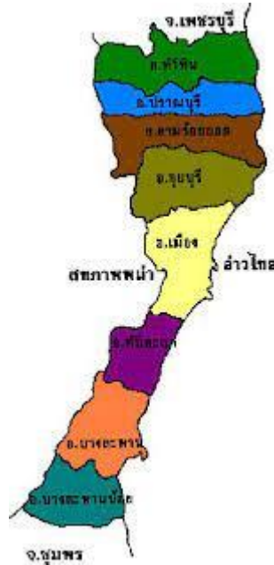
รูปที่ 4 แผนที่จังหวัดประจวบคีรีขันธ์