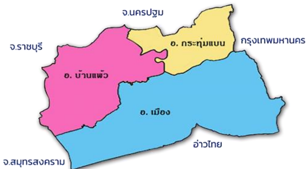
รูปที่ 5 แผนที่จังหวัดสมุทรสงคราม

พื้นที่โดยทั่วไปของจังหวัดเป็นที่ราบลุ่มริมทะเลโดยตลอด สภาพของดินเป็นดินเหนียวปนทราย ไม่มีภูเขาหรือเกาะ เดิมเคยมีป่าโกงกาง ไม้แสม ตามชายฝั่งทะเลและมีป่าจากตามปากแม่น้ำ แต่ปัจจุบันได้มีการใช้ประโยชน์จากพื้นที่ดังกล่าวในการเลี้ยงกุ้งกุลาดำเกือบทั้งหมด ต่อมาการเลี้ยงกุ้ง ได้เกิดการขาดทุน ทำให้ปล่อยบ่อกุ้งร้างจำนวนมากแม่น้ำสำคัญที่ไหลผ่าน คือ แม่น้ำแม่กลองผ่านบริเวณท้องที่อำเภอบางคนที และอำเภออัมพวา ไปออกทะเลอ่าวไทย ที่บริเวณปากแม่น้ำแม่กลองในเขตอำเภอเมืองสมุทรสงคราม นอกจากนี้มีลำคลองใหญ่น้อยมากมาย แยกจากแม่น้ำแม่กลอง 338 คลอง ลำประโดง 1,947 ลำประโดง กระจายอยู่ทั่วพื้นที่ จากสภาพภูมิประเทศเช่นนี้ ทำให้เกิดความสะดวกในด้านการคมนาคมทางน้ำ และการประกอบอาชีพด้านกสิกรรม