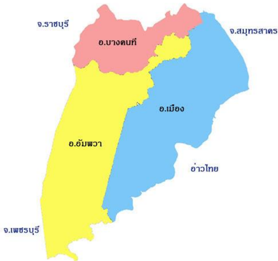
รูปที่ 6 แผนที่จังหวัดสมุทรสาคร

ภูมิประเทศ จังหวัดสมุทรสาครมีลักษณะภูมิประเทศเป็นที่ราบลุ่มชายฝั่งทะเล สูงจากระดับน้ำทะเลประมาณ 1.00 - 2.00 เมตร มีแม่น้ำท่าจีนไหลผ่านตอนกลางจังหวัด ไหลคดเคี้ยวตามแนวเหนือใต้ลงสู่อ่าวไทยที่อำเภอเมืองสมุทรสาคร ระยะทางยาวประมาณ 70 กิโลเมตร พื้นที่ตอนบนในเขตอำเภอบ้านแพ้วและอำเภอกระทุ่มแบนมีความอุดมสมบูรณ์ของดินและมีโครงข่ายแม่น้ำลำคลองเชื่อมโยงถึงกันกระจายอยู่ทั่วพื้นที่กว่า 170 สาย จึงเหมาะที่จะทำการเพาะปลูกพืชนาชนิดและบางส่วนเป็นย่านธุรกิจ อุตสาหกรรมและที่อยู่อาศัย พื้นที่ตอนล่างของจังหวัดในเขตอำเภอเมืองสมุทรสาครอยู่ติดชายฝั่งทะเลยาว 41.8 กิโลเมตร จึงเหมาะที่จะประกอบอาชีพประมงทะเลเพาะเลี้ยงสัตว์น้ำชายฝั่งและทำนาเกลือ ในช่วงฤดูฝน บางพื้นที่ประสบปัญหาน้ำท่วมหนัก ทำให้เศรษฐกิจภาพรวมเสียหายอย่างมาก โดยเฉพาะการเกษตร